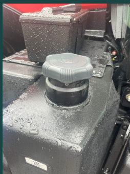
standarta degvielas bākas tvertne