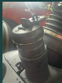
degvielas bāka ar papildu slēdzeni