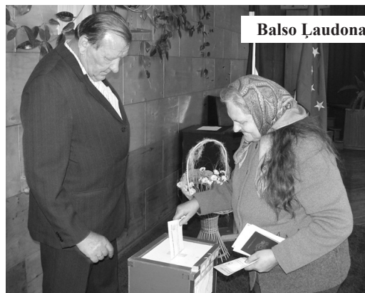
Balso Ļaudonas pagasta iedzīvotāji.