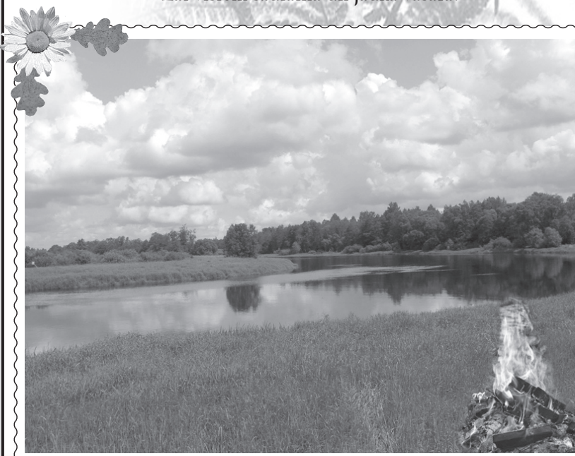
Aiviekste pie Kalniešiem.