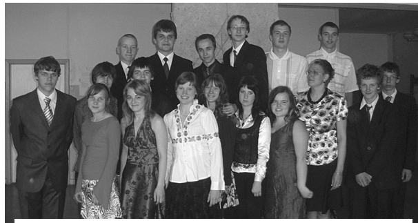
Pēdējā zvana dienā 9. klases skolēni un audzinātāja.