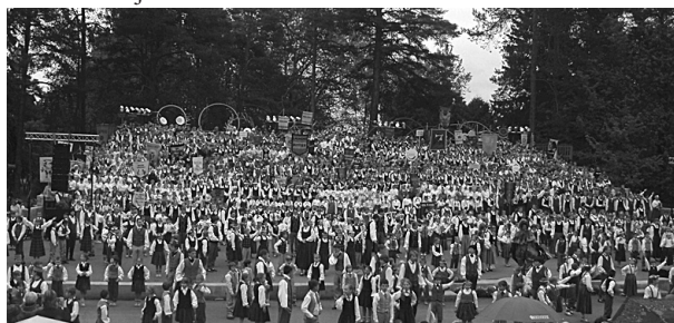
Lielkoncerta dalībnieku vidū arī Ļaudonas dalībnieki.