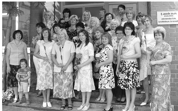
Rajona PII vadītājas un metodiķes.

Godra sirds zina, ko izvēlēties, prot no-