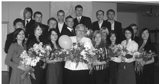
Pēdējā zvana dienā 12. klases skolēni un audzinātāja.