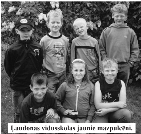
Ļaudonas vidusskolas jaunie mazpulcēni.

Ai, Jānīti, Dieva dēls, tavu staltu augumiņu! Dievs dos man lielai augt, būšu tava līgavīna.