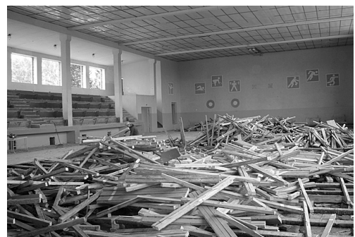
Rit remontdarbi sporta zālē.