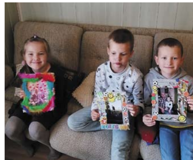
Tēvu dienas pārsteigumi!