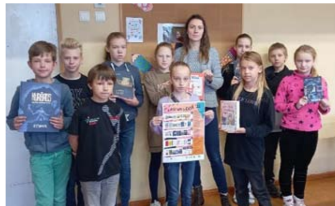
Ciemos pie piektās klases.