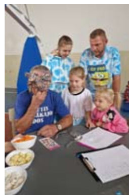
Kas šī par rudens velti?