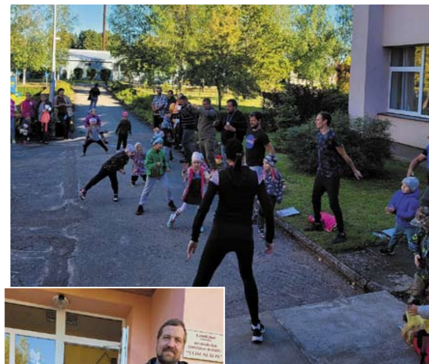
Iesildīšanās Tēvu dienas pasākumā ar sporta skolotāju.

Septembra mēnesi tika atzīmēta Tēvu diena. Arī bērnudārzā par to bija padomāts. Tēti, vectētiņi, krusttēvi tika aicināti kopā ar saviem bērniem 9. septembrī uz aktīvo pēcpusdienu „Tētis var visu!” Prieks bija redzēt kuplo tētu pulciņu, un vēl lielāks prieks bija vērot tētus darbībā kopā ar savām atvasītēm. Vislielāko atzīnību izpelnījās disciplīnas „Ķirbja turēšana”, „Lielās tēta bikses”, un „Laimas atslēdziņu meklēšana”. Tas mirdzums, kas tika iedegts bērnu acīs un taisni izslietās muguras, lepojojoties katram bērnam ar savu tēti, ir neatņemama vērtība katrā ģimenē, un tieši šie mazie laimes mirkļi ir tie, kurus bērni