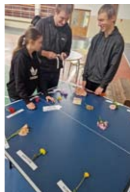
Kā sauc šo ziedu?

Pēc kopīgas sportošanas, kā jau svētku dienai pienākas, kopīgi cienājāmies ar picu un limonādi!