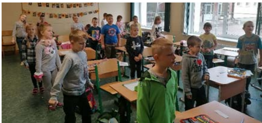
Otrā klase dzied dziesmiņu.

Paldies audzinātājiem par iespēju pie jums paciemoties un uz sadarbību!