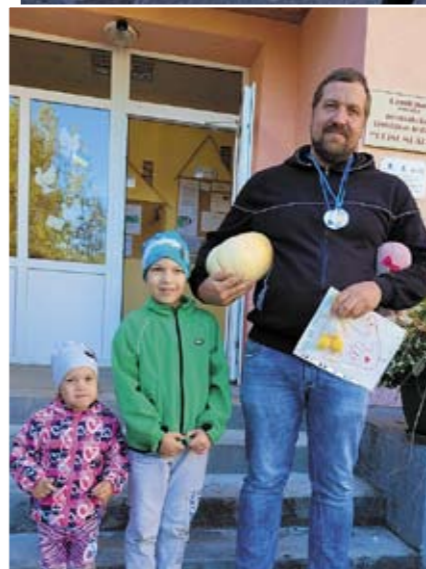
Tētis var visu!

ierakstīs savās mazajās sirsniņās, kā gaišākās atmiņas.