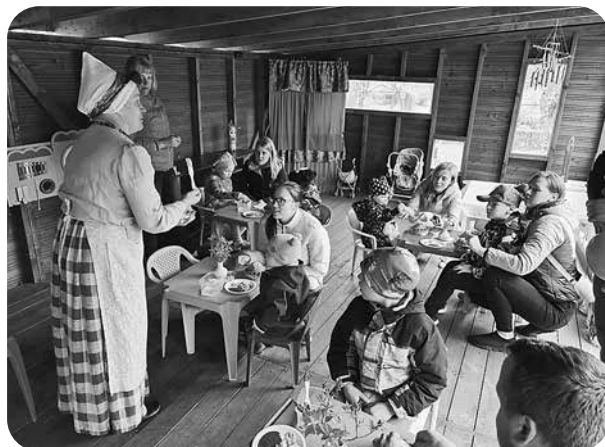
Ģimenes dienā.