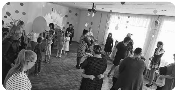
Mātes dienas pasākumā.

Projekta “Veselības veicināšanas un slimību profilakses pasākumu īstenošanas ietvaros” bērnudārza audzēkņi pieda-