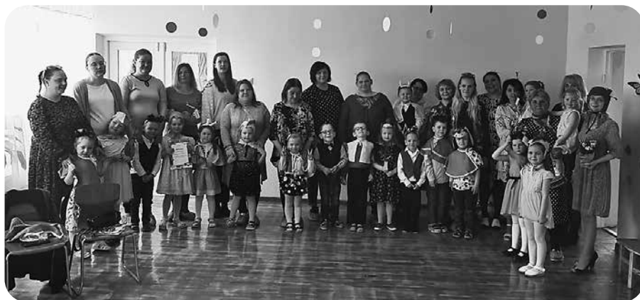
„Zaķu”, „Kaķu”, „Rūķu” grupas audzēkņi ar mammām.