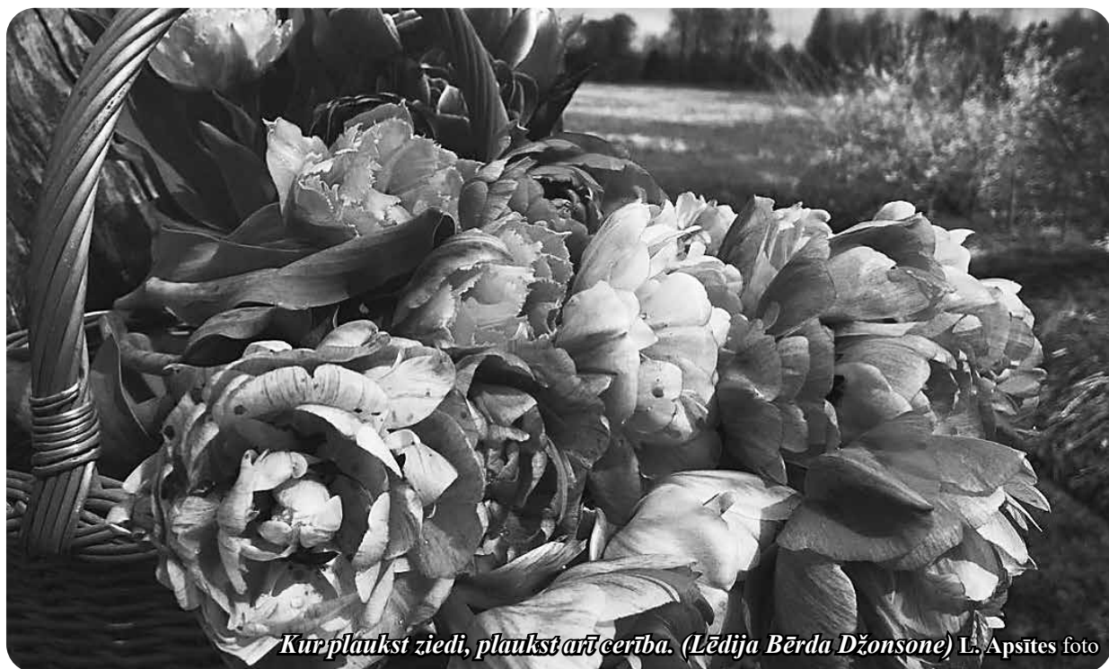
Kur plaukst ziedi, plaukst arī cerība. (Lēdija Bērda Džonsone)