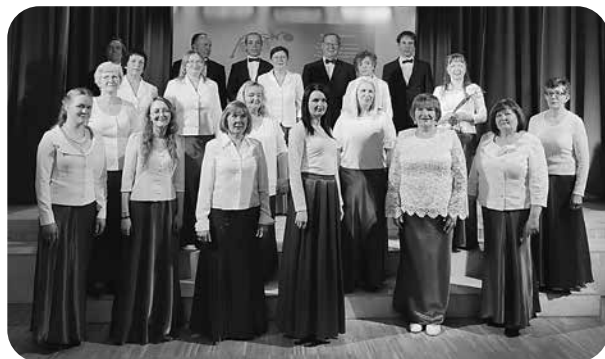
Jauktais koris „Lai Top!”

Maija otrajā svētdienā, kad visapkārt plaukst ziedi, jautri trallina putni un saule tik mīļīgi silda, svinējām Mātes dienu. Tie ir svētki māmiņām un vecmāmiņām – mūsu vismīļākajiem un jaukākajiem cilvēkiem visā plašajā pasaulē. Māte ir ikviena cilvēka lielākais dārgums.