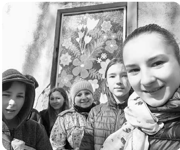
Ļaudonas iepazīšanas trasītē.