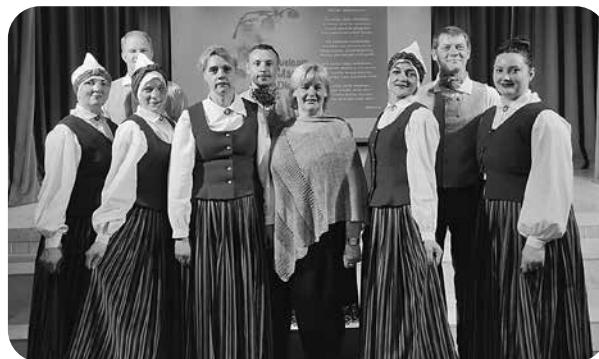
Vidējās paaudzes deju kolektīvs „Grieze”.

Ikdienas steigā dažkārt aizmirstas, ka jāapskauj sava māmiņa, jāpasaka silti un mīļi vārdi, kuri slēpjas ikviena