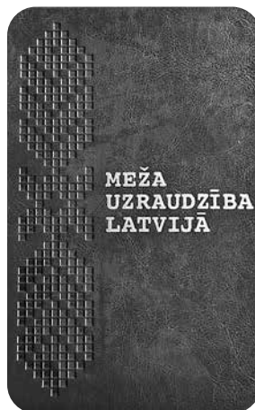
J. Vanaga grāmatas vāks „Meža uzraudzība Latvijā”.