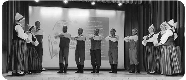
Senioru deju kolektīvs „Divi krasti”.

Veselību mums visiem – gan pašdarbniekiem, gan skatītājiem!