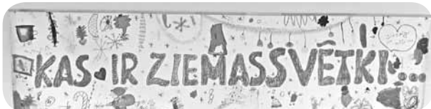
Plakāts „Kas ir Ziemassvētki?”.

Ļaudonas PII „Brīnumdārzā” 2. decembrī aizsākās Labo darbu mēnesis. Šoreiz Rūķis katrai grupai vēstuli ar darba uzdevumiem nodeva caur logu. Bijām patīkami pārsteigti, jo Rūķis iededza mūsu lielo eglī, kas liecina, ka svētki nāk.