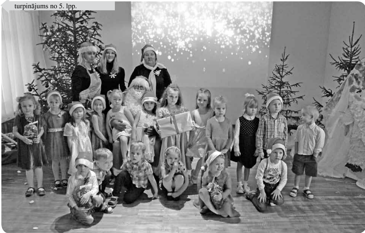
„Rūķu” grupas skolēni kopā ar skolotājām savas grupiņas eglītē.

„Rūķu” grupa. Otrā labo darbu nedēļa Visiem sen zināms, ka rūķi ir visčaklākie Ziemassvētku vecīša palīgi, tādēļ arī šonedēļ rūķis Čammiņš ieradās ciemos. Bērni iepriekš jau bija saņēmuši aicinājumu tikties un sagaidīja viņu bērnodārza zālē. Čammiņš atnesa līdzīgu lielu lādi, kurā slēpās gan iepriekšējā nedēļā paveicamie uzdevumi