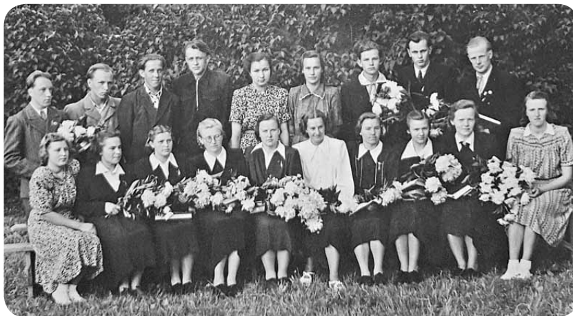
Ļaudonas vidusskolas 1. izlaidums (1954). 11. klases absolventi un 10. klases skolēni (izlaiduma rīkotāji).