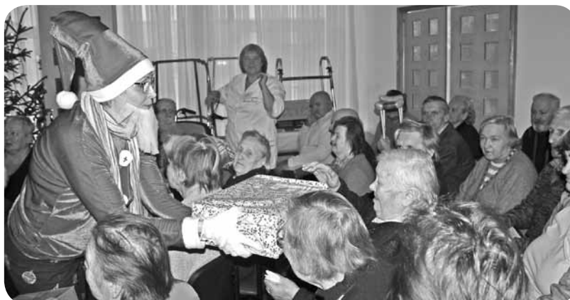
Ar izrādi, ciemojoties Ļaudonas pansionātā, rūķi iepriecināja tā iemītniekus, pasniedzot labdarības akcijas "Eņģeļu pasts" sarūpētās dāvanas.

Darbs pie šīs lugas prasīja arī īpašu skatuves iekārtojumu, rekvizītu sagādāšanu, tērpu šūšanu, dziesmu mācīšanos, lai tas viss kopā uzburtu patiesi brīnišķīgu izrādi un iepriecinātu lielo un mazo skatītāju sirdis.