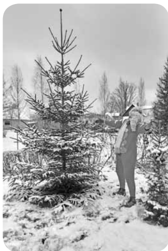
Atraktīvais Rūķis pie Ļaudonas pirmsskolas izglītības iestādes eglītes.

Katram no mums ir savas atšķirīgas Ziemassvētku sajūtas un svinēšanas tradīcijas. Kas mums šai laikā ir vissvarīgākais? Kaut kas tiek darīts tāpēc, ka tā ir pieņemts, tā mēs vienmēr esam darījuši, tā visi dara, un tāpēc tas arī šķiet pareizi. Tāda kopumā ir cilvēku dzīves ikdiena. Ziemassvētki ir īpašs un maģisks laiks, kad gandrīz katrā cilvēkā rodas vēlme izdarīt ko labu. Šis ir laiks, kad cilvēks, kurš pats piedzīvojis sirds siltus svētkus, vēlas, lai arī citiem tādi ir.