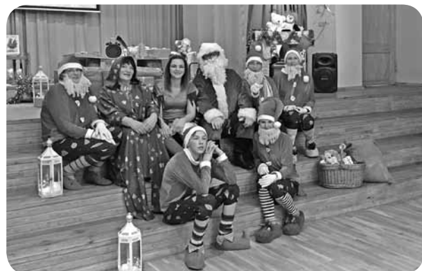
"Rūķubodes" rūķi un Ziemassvētku vecītis ciemojoties pie Mētrienas bērniem.