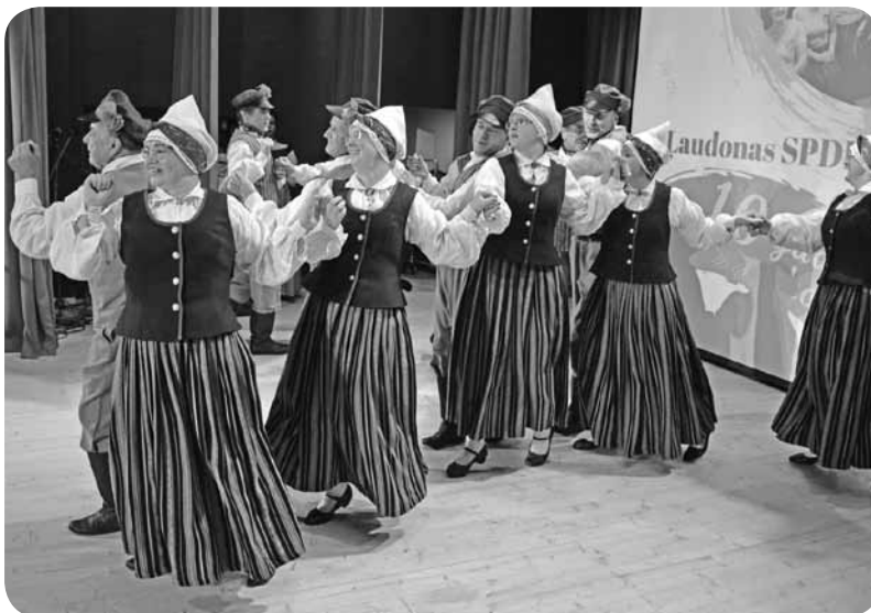
Deja rada prieku.