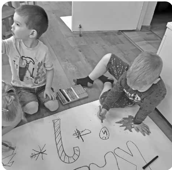
Rūķis bija atstājis milzīgu plakātu ar jautājumu - Kas ir Ziemassvētki? Tur visiem, visiem, lieliem un maziem, bija jāuzzīmē, kas tad raksturo Ziemassvētkus.

Kas ir Ziemassvētki? To mēs - Ļaudonas PII „Brīnumdārzs” saime - vēlējamies noskaidrot 2019. gada decembrī. Kā mums veicās?