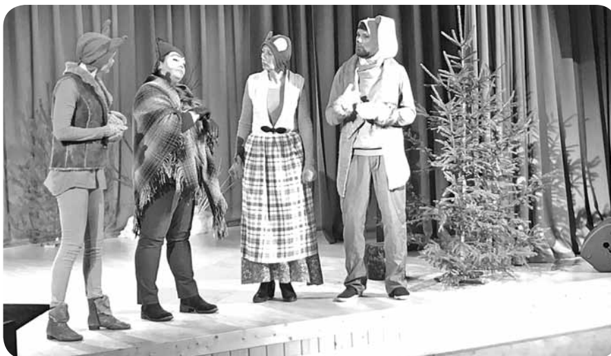
Pasaku meža zvēri, kuri vēlējas nosvinēt Ziemassvētkus.

13. decembrī Ļaudonā tika uzburta svētku noskaņa. Ar jauku uzvedumu un muzikāliem priekšnesumiem priecēja Praulienas pagasta amatiermākslas kolektīvi - Saikavas amatiermākslinieki, deju grupa "Saikavieši" un Praulienas pagasta jauktais koris.