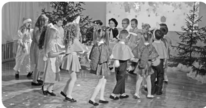
PIL „Brīnumdārzs” vecāko skolēnu uzstāšanās.