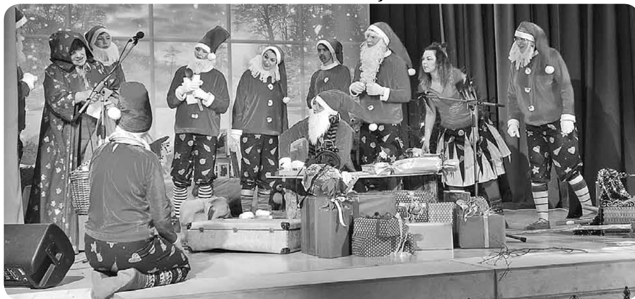
Lielā rūķu saime un Meža māte.

Ļaudonas pagasta amatiereteātris (režisore Anna Anita Amata) Ziemassvētkiem gatavojās īpaši rūpīgi. Tika iestudēta luga "Ziemassvētki Rūķubodē". Sirsnīgs stāsts par čaklajiem rūķiem, kuri strādā "Rūķubodē" un gādā dāvanas. Taču negaidīti un noslēpumaini pavērsieni draudēja izjaukt visu dāvanu piegādāšanu adresātiem. Galu galā, protams, viss beidzās labi, un mistiskie noslēpumi tika atklāti. Tad rūķi kopā ar bērniem varēja svinēt Ziemassvētkus un sagaidīt Ziemassvētku vecīti.