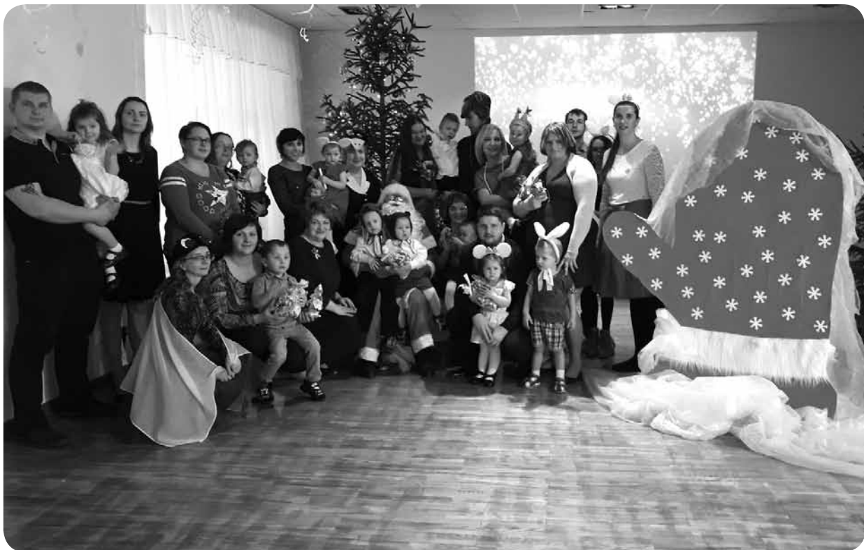
„Zaķu” grupas skolēni Ziemassvētku eglītes pasākumā kopā ar vecākiem un skolotājām.

Par to turpina “Zaķu” grupa. Pirmā labo darbu nedēļa. Saņēmuši Rūķa vēstuli, grupā kopā ar bērniem izpētījām un izlasījām dotos uzdevumus. Mums vajadzēja sapost Rūķa atnesto durvju vainadziņu, nedēļas garumā izgreznot telpas un sagatavot rotaļu, kuru iemācīt citiem draugiem.