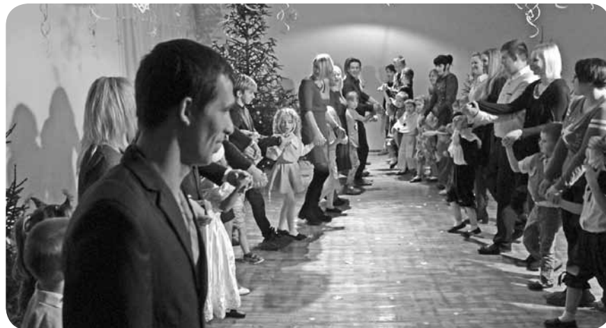
„Kaķu” grupiņas audzēkņi kopā ar saviem vecākiem.

„Kaķu” grupas bērni bija sagatavojuši izrādi par 12 mēnešiem, kurā norisinājās dažādi notikumi. Tika satikti visi 12 mēneši, ziemas laikā uzziedēja sniegpulksteņi, ar pamāti un meitu notika dažādas pārvērtības. Arī svētku dienas vakarā uzradās ista vētra Ļaudonā, pazuda elektrība. Priecājāties, ka Ziemassvētku vecītis veiksmīgi atceļoja pie mums un bērniem dalīja dāvanas lukturišu gaismā. Tas bija kaut kas vēl nepiedzīvots un nebijis! Viss beidzās labi, un svētki tika pavadīti draudzībā un mīlestībā.