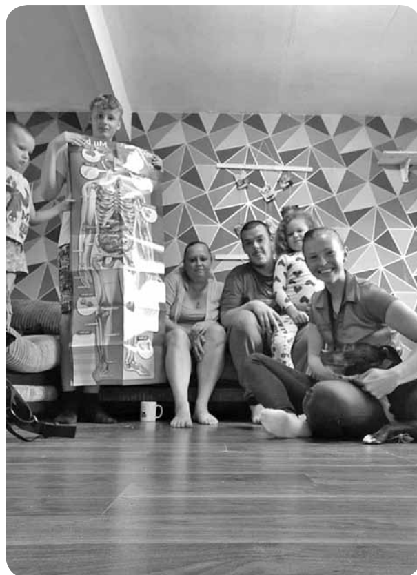
Kopbildes ar ģimenēm, kuras tika apciemotas, lai pārdotu izglītojošo literatūru.