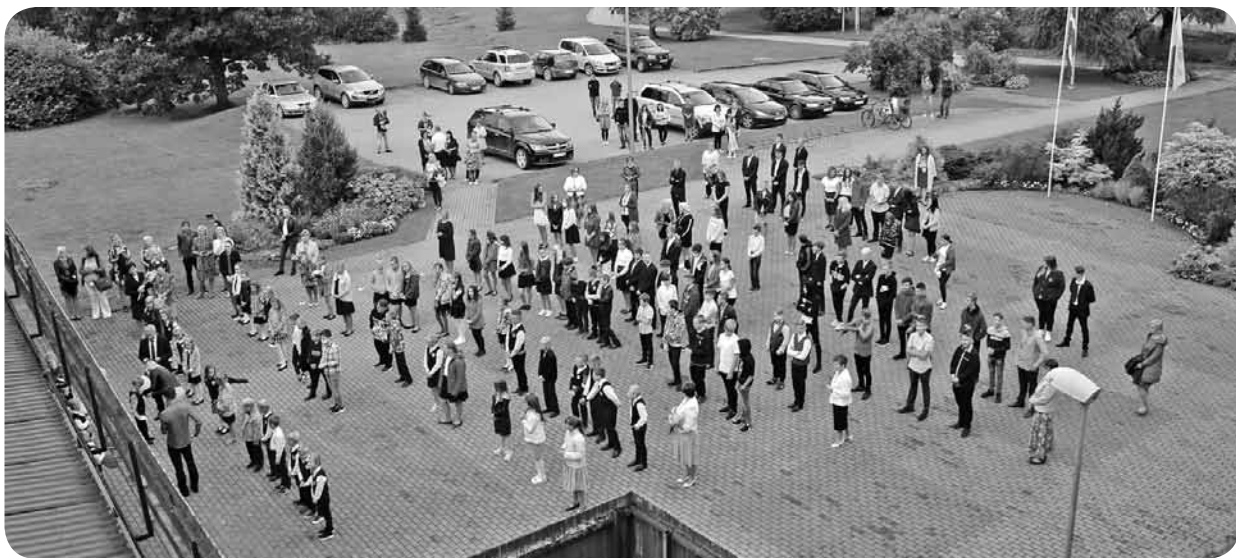
Andreja Eglīša Ļaudonas vidusskolas skolēni Zinību dienā.

Sveiciens visiem laikā, kad Dabas grāmata šķir pirmās rudens lappuses! Ar vēsiem vakariem, putnu nemieru un oranžajiem pīlādžiem ir atnācis septembris. Ir skaidrs – saules pulksteņi neapstājas.