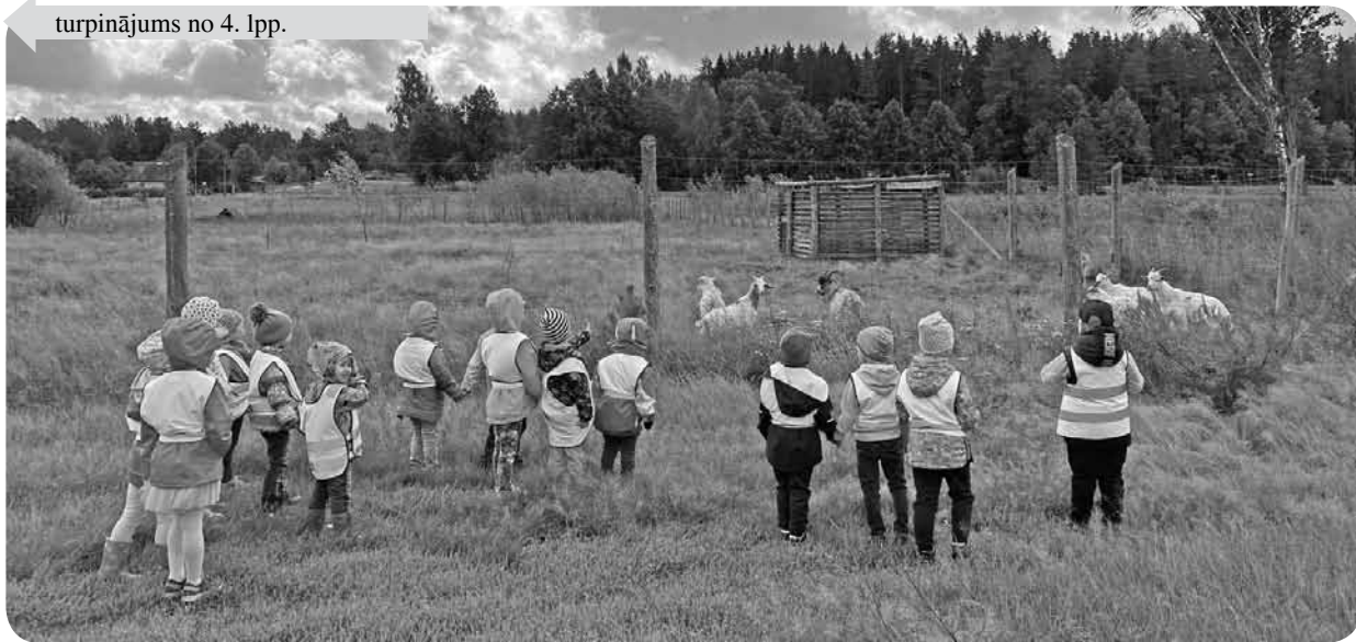
PII „Brīnumdārzs” audzēkņi pastaigas laikā.