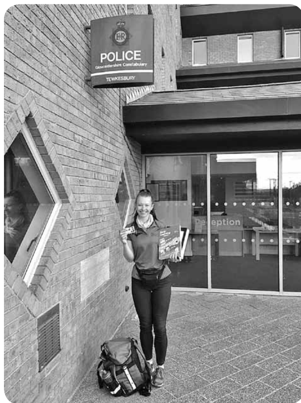
Fotogrāfijas pie policijas iecirkņiem ar Southwestern Advantage identifikācijas karti un materiāliem.

Nekādā gadījumā nenožēloju savu izvēli doties šovasar prom no mājām, jo šī bija fantastiska pieredze. Tas, ko es ieguvu, ir vārdos neaprakstāms. Pēc šīs vasaras man mazliet ir mainījusies domāšana un skats uz dažādām lietām. Ir mainījušies arī uzskati, es tagad daudzas lietas daru citādāk.