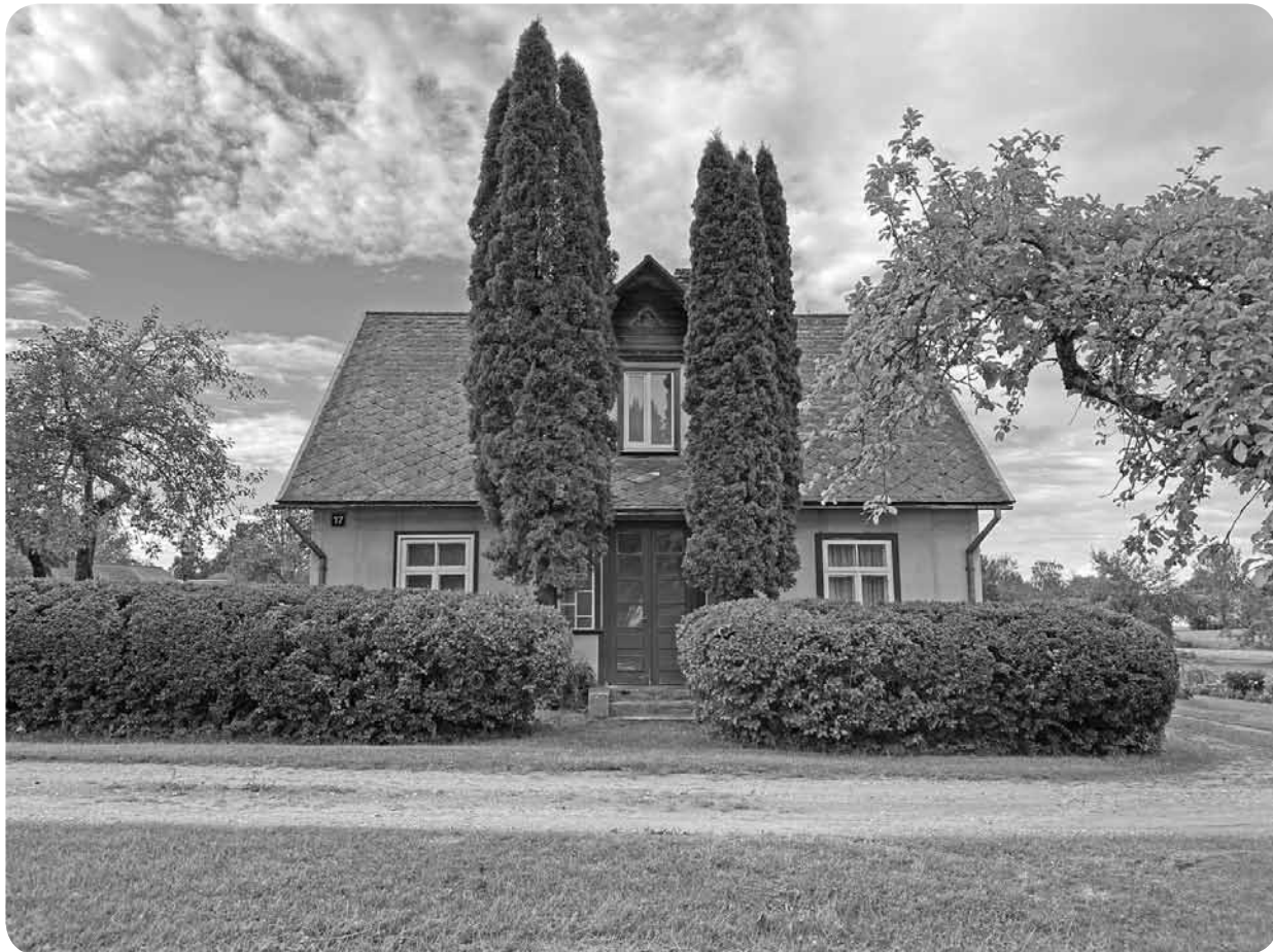
Graudu iela 17. Aizsilnieku māja, celta pirms 70 gadiem.