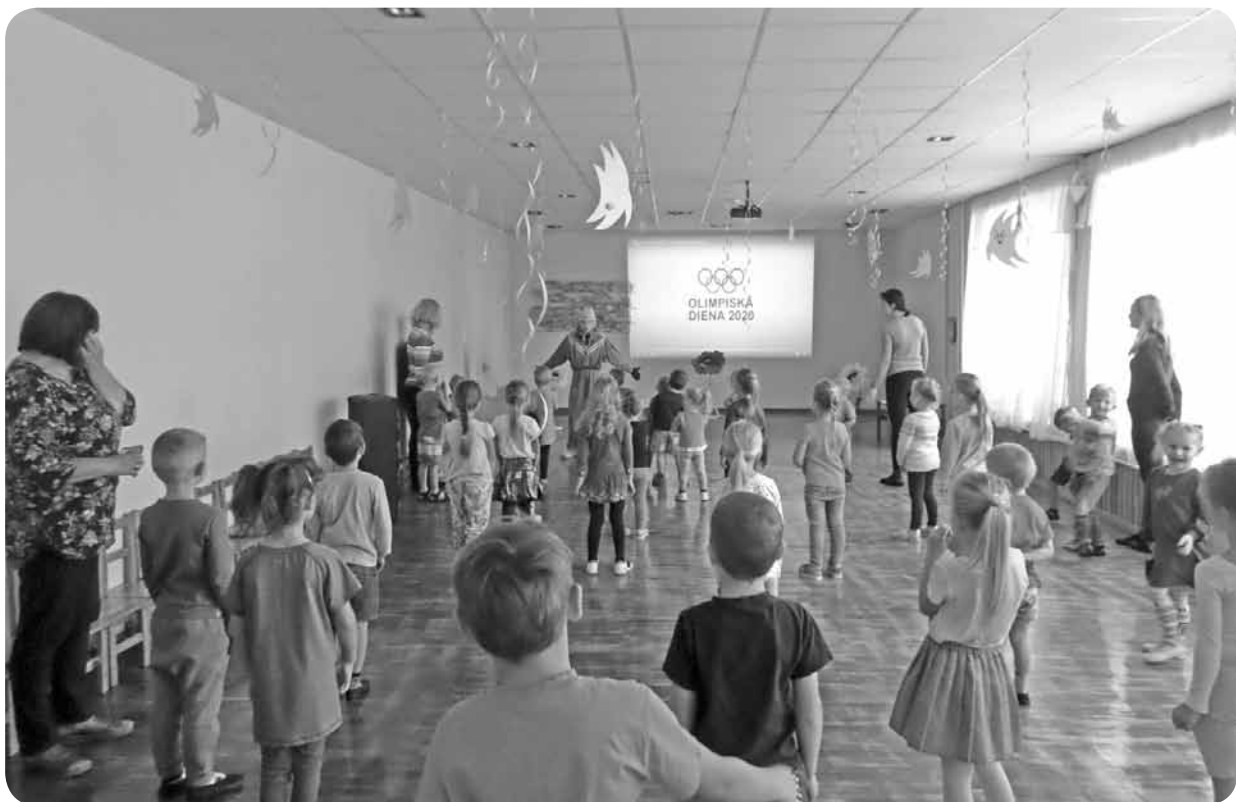
Olimpiskās dienas aktivitātes.