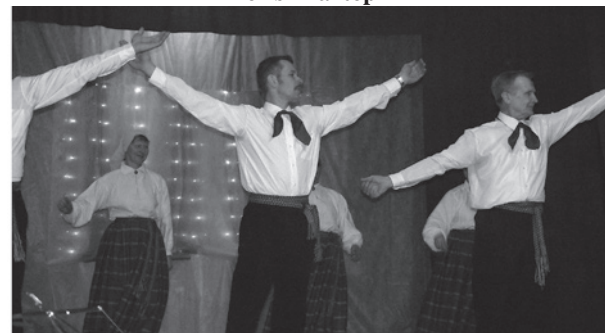
Vidējās paaudzes deju kolektīvs.