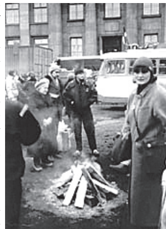
1991. gada janvāris - uguns kurš uz Rīgas asfalta.

Barikāžu laiku savās atmiņās atceros kā skaistu vienotības laiku ar daudziem uguns kuriem Rīgā.