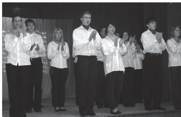
Jauniešu deju kolektīvs.

17.decembrī lielās Ziemassvētku eglis iedegšana laukumā pie veikala „Dīvari”. Te pulcējās vairāki desmiti ļaudoniešu, lai kopā iedegtu Ziemassvētku eglī, satiktos ar Ziemassvētku vecīti un priecātos par jauko salūtu.