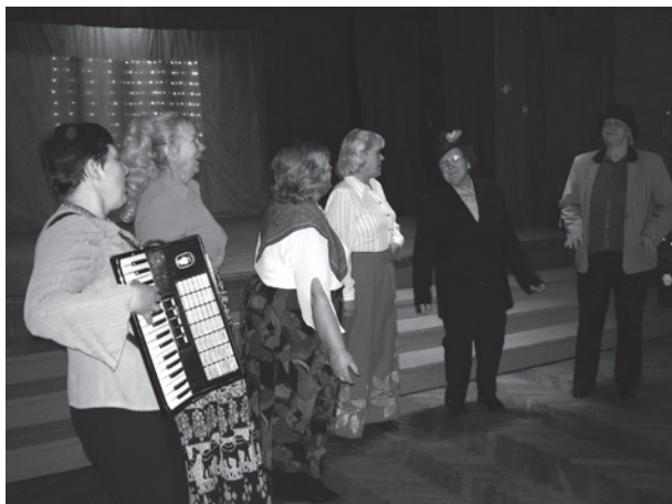
Mārcienas ansamblis "Varavīksne".

29.decembrī Ziemassvētku eglīte pagasta pensionāriem.