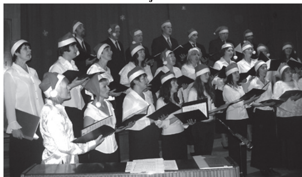
Koris "Lai top".

17.decembrī lielās Ziemassvētku eglis iedegšana laukumā pie veikala „Dīvari”. Te pulcējās vairāki desmiti ļaudoniešu, lai kopā iedegtu Ziemassvētku eglī, satiktos ar Ziemassvētku vecīti un priecātos par jauko salūtu.