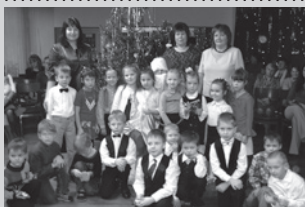
Pagasta izglītības iestādēs