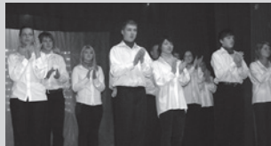
Kultūras pasākumu apskats