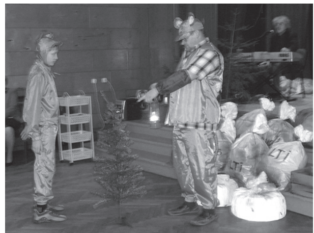
Ziemassvētku pasākums PII bērniem pagasta kultūras namā.