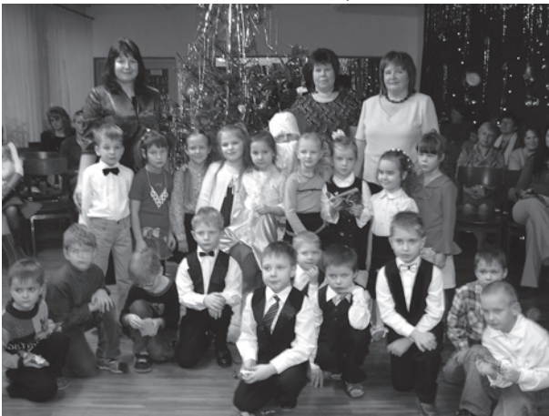
"Kaķu" grupas bērni kopā ar Ziemassvētku vecīti.

Jāsaka jau liels paldies, ka ir tāda iestāde, kur var atstāt savus bērnus un paļauties uz to, ka viņi tiks pieskaftīti, pabaroti un arī iemācītas noderīgas pamatprasmes turpmākajai dzīvei. Tieši par pasākumiem "Zaķu" grupā esmu ļoti apmierināta, kā tur viss tiek organizēts un uz priekšu plānots, ko bērniem jaunu parādīt un sniegt. Ne tikai lielos svētkos, bet arī ikdienā tiek atzīmētas bērnu dzimšanas dienas, bērni cits citam sniedz