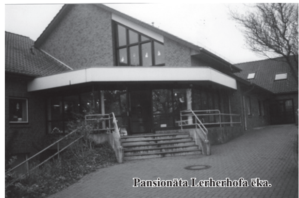
Pansionāta Lerherhofa ēka.