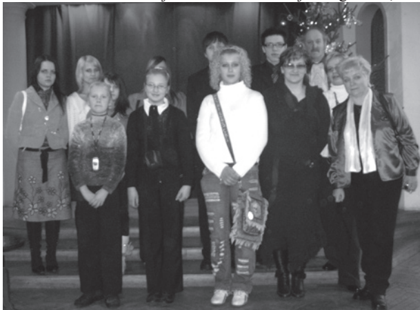
E.Smiļģa muzejā viņa paša projektētajā telpā, kurā ieejot, varēja justies kā teātri.

Ir agrs rīts. Saules sarkanā bumba apspīd Aivieksti, Ļaudonu, Andreja Eglīša dzimto novadu. Šodien ir 6.janvāris – Zvaigznes diena, un mēs, Ļaudonas vidusskolas skolēni, skolotāji un pagasta padomes priekšsēdētāja, dodamies uz Rīgu, E. Smiļģa Teātra muzeju, kur atvērta izstāde „Tik un tā”. Izstādes nosaukums ir aizgūts no Māras Zālītes dzejoļa, kas ir arī sava veida moto. Šajā izstādē ir skatāmi jaunieguvumi, kas