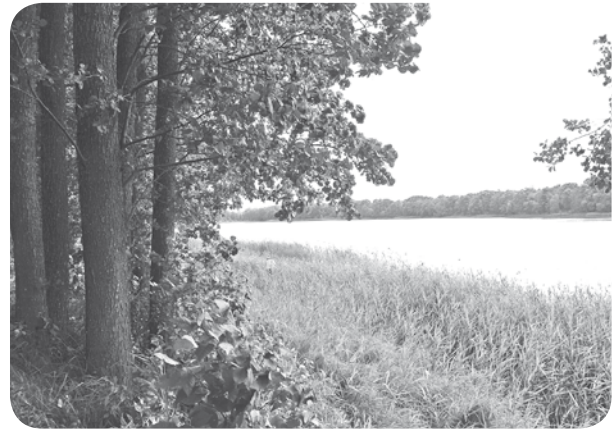
Sāvienas ezers 2015. gadā.