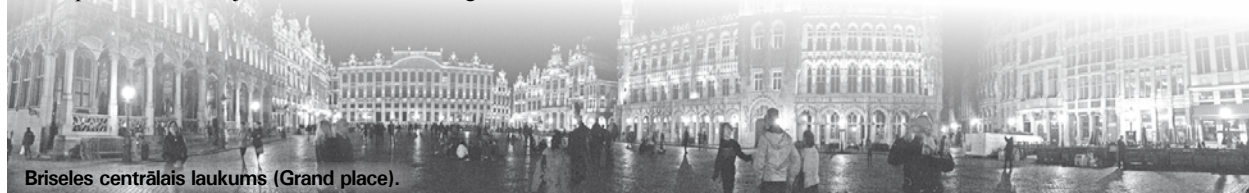
Briseles centrālais laukums (Grand place).

Ieva Skuške, Ļaudonas pagasta bibliotēkas vadītāja