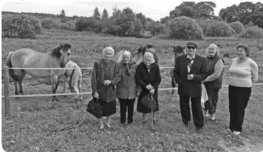
Daļa no pasākuma dalībniekiem netradicionālajā saimniecībā "Bieles".

Tās pāris stundas, kurās bijām kopā, apskatot saimniecību, runājoties par pagātņi, tagadni un nākotni un dažādiem