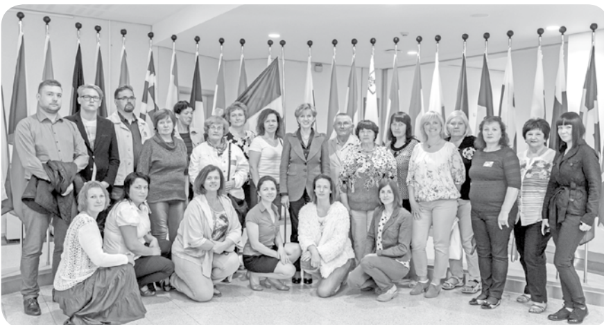
Kopīga fotografēšanās kopā ar Eiropas Parlamenta deputāti Inesi Vaideri.

Ir ļoti apskatīt citas valstis, bet vienmēr jau jāpatur prātā, ka arī pie mums Latvijā ir, ko redzēt. Katru gadu bibliote-