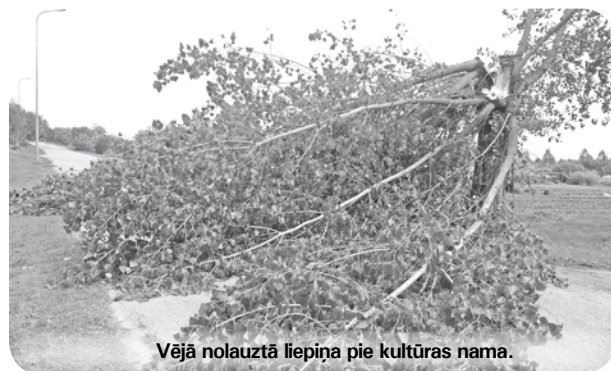
Vejā nolauztā liepiņa pie kultūras nama.