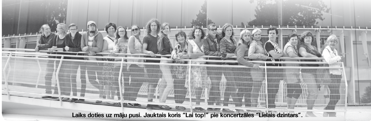
Laiks doties uz māju pusi. Jauktais koris „Lai top!” pie koncertzāles „Lielais dzintars”.

Ieva Melnupa-Ancāne, jautkā kora „Lai top!” soprāns