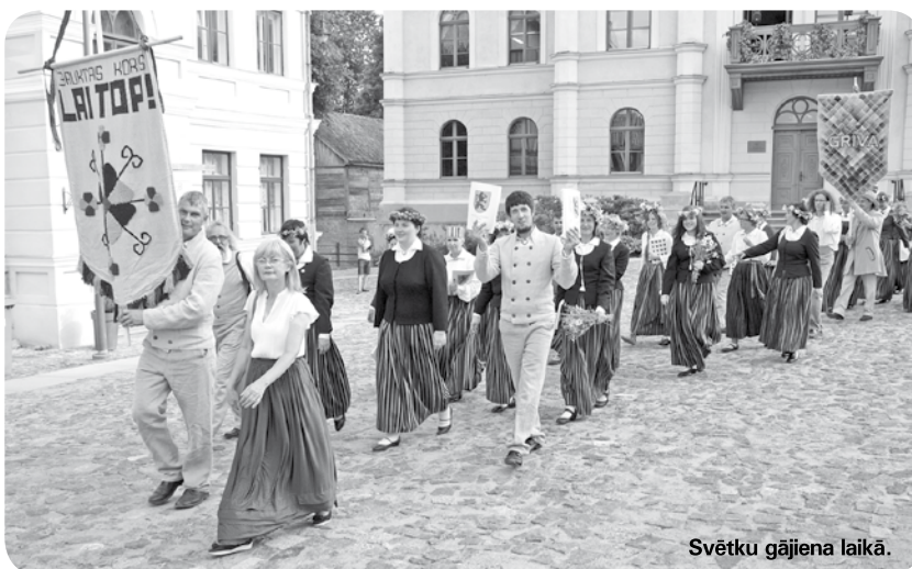
Svētku gājiena laikā.

Skaistos brīžus ne tikai gribas, bet arī vajag paildzināt. Tāpēc arī mēs izlēmām uz mirkli uzkavēties Kurzemē, lai turpinātu smelties sajūtas un to skaistumu, kas mums nav