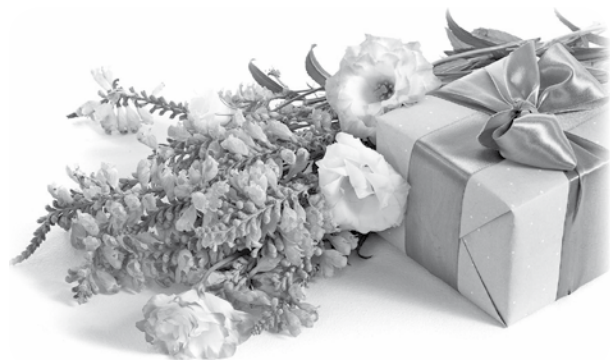
5. janvārī 75 gadu jubileju atzīmēja DZINTRA KĻAVIŅA

Vēlam jubilāriem stipru veselību, možu garu un daudz tuvinieku mīlestības.