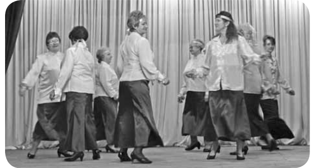
Dejo Dāmu deju grupa.

Laikā pēc Ziemassvētkiem, tuvojoties gadu mijas sliksnim, uz kopā būšanas pasākumu pulcējās pagasta vecākā paaudze, kas (pārsvārā tie bija cienījama vecuma ļaudis) Veco gadu pavadīja ārkārtīgi liksmā noskaņojumā ar rotaļām un pat dejām.