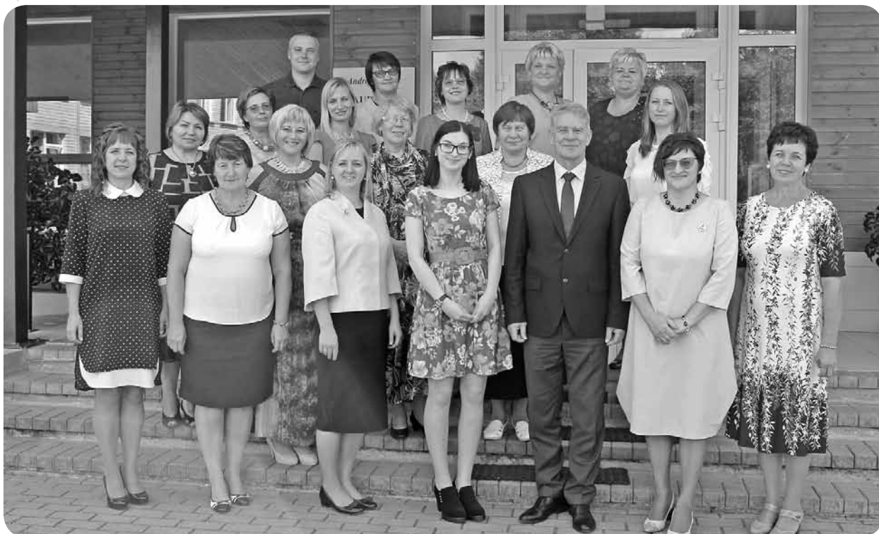
A. Eglīša Ļaudonas vidusskolas skolotāju kolektīvs.