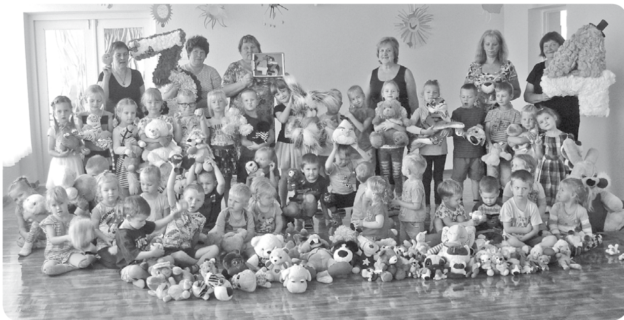
Bērni priecīgi par jaunajām mantām, kuras varēs izmantot gan rotaļās, gan mācību nodarbēs.