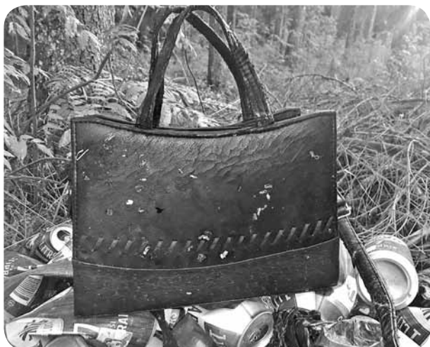
Pagasta pārvaldē tika iesūtīts foto, kur redzami mežā izgāztie atkritumi - līdzās sadzīves atkritumiem gozējas arī dāmu somaņa...

Skumjš stāsts tepat no mūsu mīļās Ļaudonas mežiem. Paldies vērtīgajiem iedzīvotājiem par rūpību, kad tiek savākti aiz citiem cilvēkiem, kuri nekastrējoties kā cūkas, savus atkritumus izgāž mežā. Kā jūs naktīs guļat, zinot, ka piemēslojat mūsu Latviju, vidi sev apkārtnē? Vidi, kurā dzīvo gan jūsu draugi, gan ģimenes, gan paziņas, radi, darba kolēģi, skolas biedri, skolotāji, bērni, pensionāri. Arī zvēri mežā. Kā jūs jūtaties tajā brīdī, kad slapstāties pa pagastu vai mežu, slēpjot to, ka izberat savus atkritumus nekaunīgi? Un pats galvenais, ka jūsu ļaužu šaurais loks ir zināms. Katra cilvēka pienākums, kā likums to nosaka, jo katrs mēs (katra mājsaimniecība) ir atkritumu ražotājs, tādēļ katram (katrai mājsaimniecībai) ir pienākums noslēgt līgumu ar atkritumu izveņēmējiem (Ļaudonu apkalpo SIA "Madonas namsaimnieks"). Un tie, kuriem šāda līguma nav, automātiski ir likuma pārkāpēji. Cieņsim sevi un citus, nemēslosim mežos un citu cilvēku īpašumos (arī konteineros, kas nepieder jums).