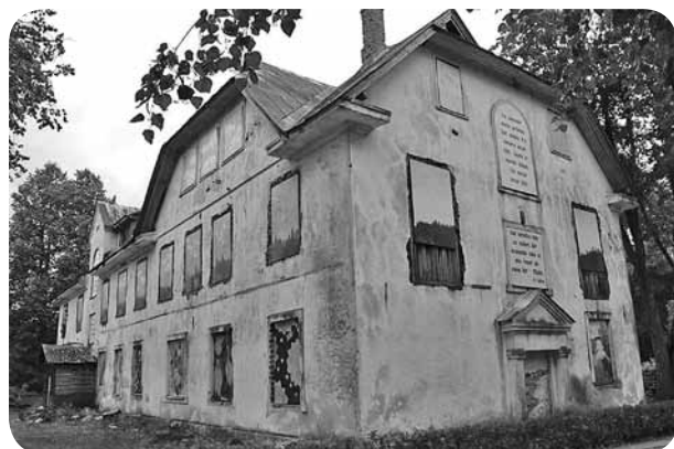
Dāvana skolai Latvijas 100gadē. Ceram, ka šim mākslas projektam būs turpinājums jau citādākā veidolā, aizsākot rakstu sēriju avīzē.

Kopīgā projekta izdevumu summa ir 710,98 eiro, no kuriem 695,02 eiro tika segti ar ziedojumiem. Ar šo slēdzienu un vēl vienu milzīgu Paldies arī pieliksīm šim pasākumam punktu un novēlēsim vecajai skolai vēl ilgu mūžu - ne īsāku par Latvijas simts gadiem!"