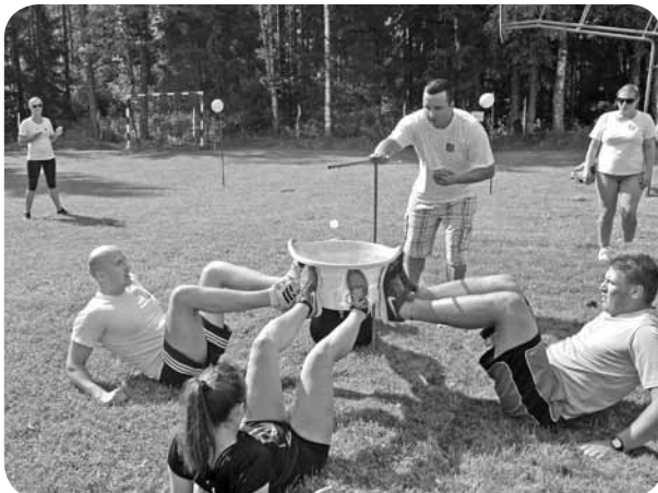
Komandai pacelt bļodu, kas pilna ar ūdeni, nemaz nebija grūtākais uzdevums.