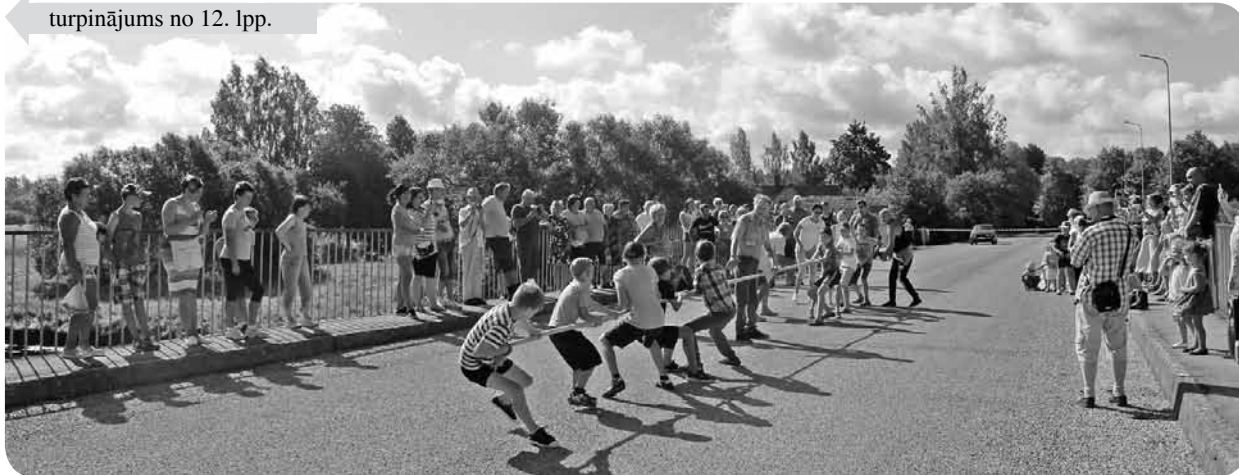
Allaž atraktīvā un azartiskā virves vilkšana.