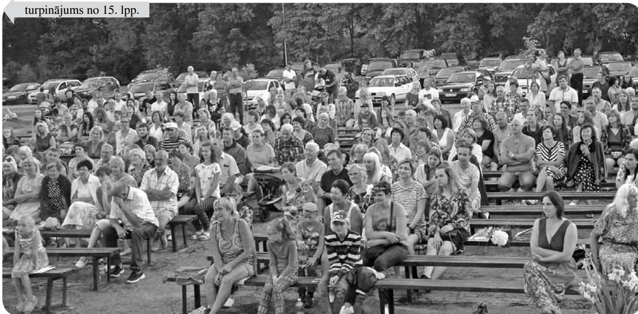
Baltinavas teātris „Palādas” ir iemīļots ļaudoniešu vidū. Allāž prieks redzēt pilnas skatītāju rindas!