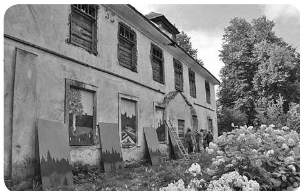
Iesaistoties vairākiem ļaudoniešiem, vecā skola tiek tērpta svētku rotā.