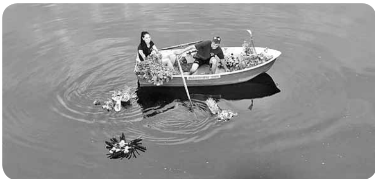
Aiviekstes upē tika palaistas ziedu laivas, ko īpaši šai nometnei gatavoja katra mazpulku grupa.

pārvaldes vadītājam par atbalstu nometnes darbībai, skolas direktoram un visam skolas kolektīvam par sapratni, uzņemot savās telpās dalībniekus. Paldies radošo darbnīcu vadītājiem, šoferīšiem, apsargiem! Liels paldies par garšīgajiem ēdieniem! Mums viss ļoti garšoja! Paldies skolas saimniecei, tehniskajiem darbiniekiem par palīdzību un atbalstu nometnes laikā!