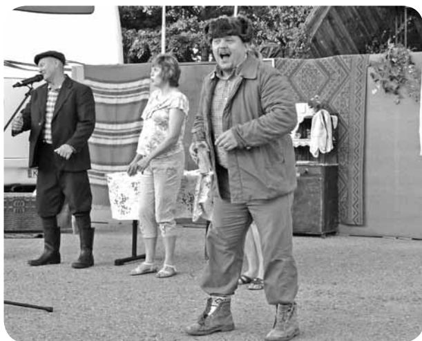
Kolorītie tēli spēj smīdināt līdz asarām.