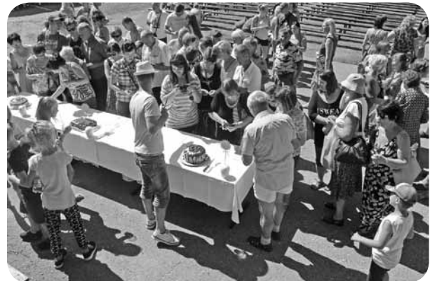
Kūku degustācija ir gardākais un ļaudoniešu gaidītākais mirklis konkursā.

cita par citu skaistāka, tomēr ļaudoniešiem bija jāveic balsošana, norādot savu favorītkūku.