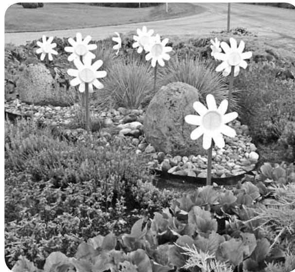
Ceļu krustojums svētku rotā.

ievietotie mākslas darbi, kuri nu jau pāris nedēļas ir apskatāmi katram interesentam. Ceru, ka arī pašu veco skolu šīs izmaiņas nedaudz atsvaidzinās un iekrāsos Latvijas simtgades cienīgās nokrāsās. Vēlos atkārtoti izteikt pateicību visiem iesaistītajiem par iedvesmu, iedrošināšanu, organizēšanu, padomiem, mākslas darbiem, praktisko palīdzību, uzstādīšanu, publikācijām novada laikrakstā un atklāšanu pagasta svētku ietvaros. Atsevišķi jāpiemin arī visa veida finansiālais atbalsts, ko saņēmām no projekta sākuma līdz pašām beigām. Neviens ziedojums nebija par