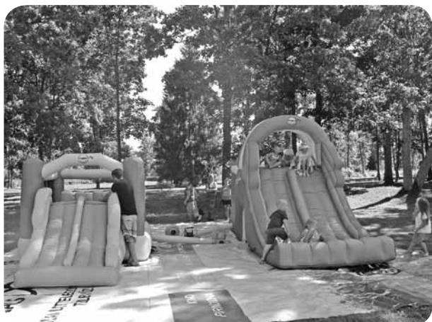
Bērni bez maksas varēja baudīt izpriecās piepūšamajās atrakcijās.

„Vecās skolas logu stāsts ir veiksmīgi noslēdzies. Pagasta svētku ietvaros, 4. augustā, atklāti tika logu ailēs