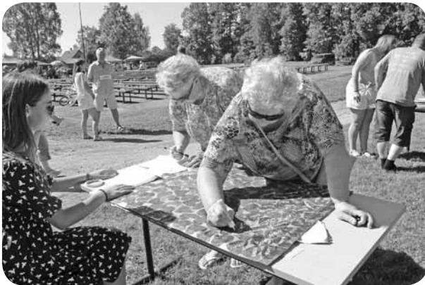
Ļaudonieši ar prieku atsaucās akcijai „Mana sirds ir Latvija”, atstājot sirdi savu vārdu.