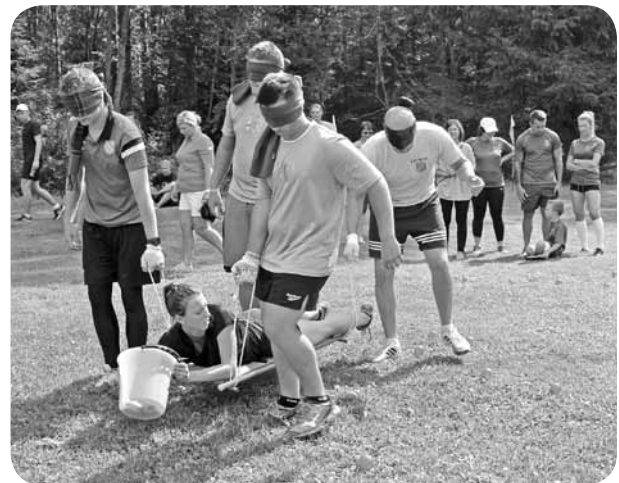
Disciplīna „Ātrā palīdzība”.