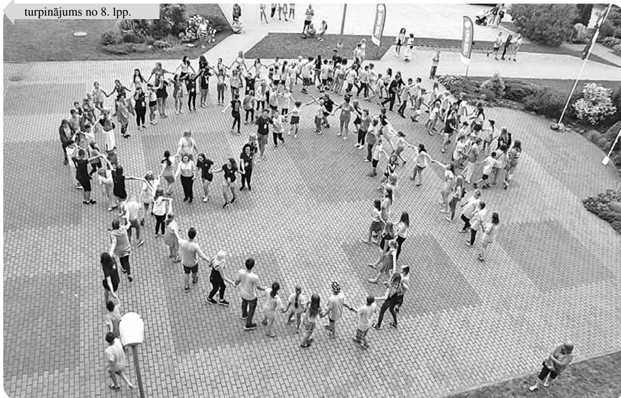
Skolas pagalmā tiek veidots Latvijas Mazpulku simbols - četrlapu āboliņš.