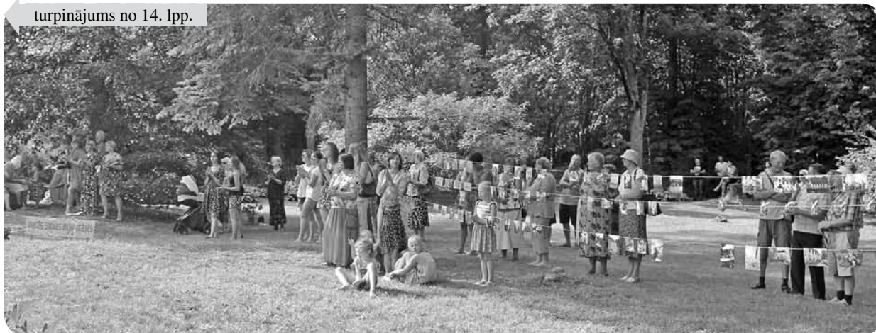
„Vecās skolas logu stāsts” uzrunāja daudzus ļaudoniešus.