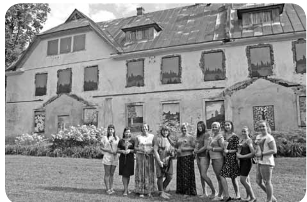
Logu gleznu autore (attēlā nav visi autori) gandarītas par paveikto.

Liels paldies visām trim kūku cepējām par iniciatīvu, atbalstu un drosmi! Lai top vēl daudz gardu kūku!