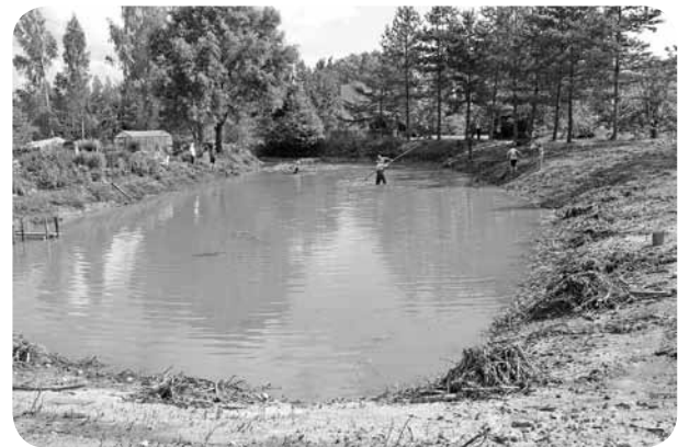
Dīķa sakopšanas darbi. Nu šī ūdenstilpne ieguvusi arī nosaukumu – „Grimoņi”.

sionāta iemītniekiem ir iespēja būt pie ūdens un relaksēties, ir noslēdzies. Radās jaunas idejas projekta turpinājumam, jauna projekta pieteikumam un realizācijai.