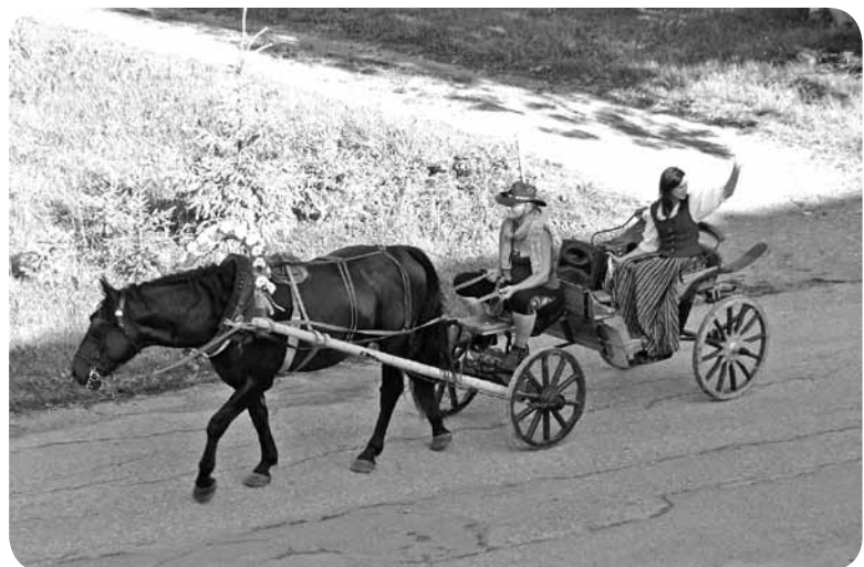
Rīta modinātājs – rikšotājs ar „dīpadu - dīpadu” pieskandināja Ļaudonas ielas.