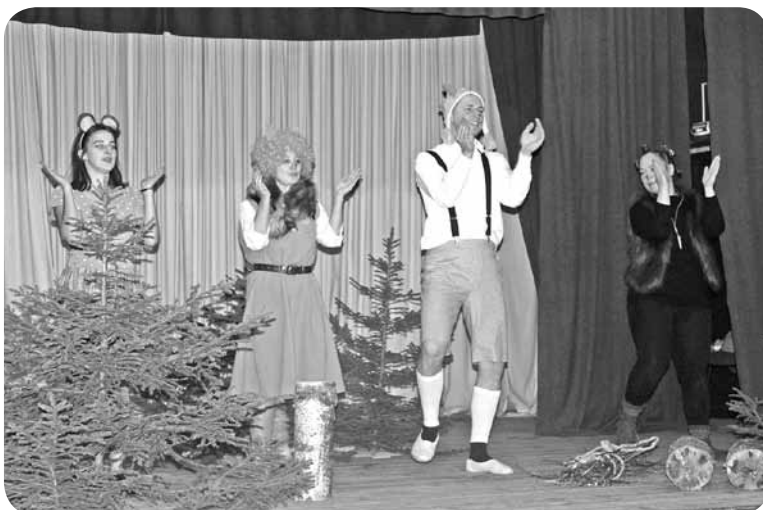
Vestienas amatierteātris "Aušas" ar pamācošo pasaku par meža zvēriņiem.

Pēc pamācošās pasakas noskatīšanās un cienāšanās ar zaķa sarūpētajiem veselīgajiem gardumiem (paldies Vestienas amatierteātrim "Aušas") bērni kopā ar Rūķeni adīja vilkam zeķes un ķēra kaziņas, līdz pie loga parādījās Ziemassvētku vecīša koši sarkanā cepure un garā, baltā bārda. Viņš bija ieradies! Lielākie bērni droši devās sagaidīt Ziemassvētku vecīti un laipni ierādīja vietu pie eglītes. Nu vecītis varēja uzklaustīt bērnu sagatavotos dzejolišus. Pašiem mazākajiem ļaudoniešiem dāvaniņu palīdzēja nopelnīt vecāki vai brāļi un māsas.