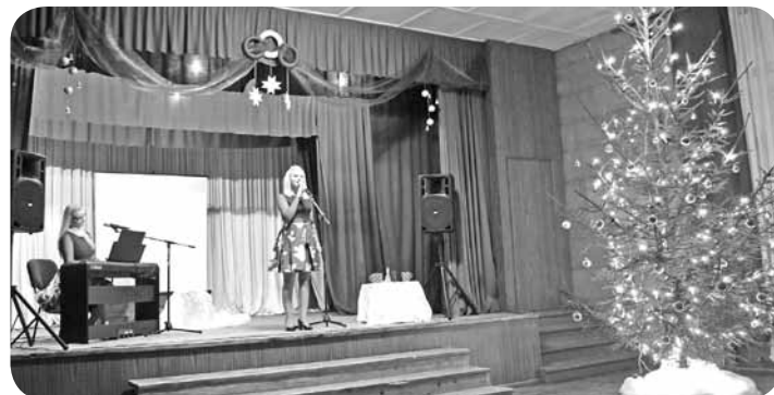
Iemīļotas melodijas, skanīgs balsis, skaista klavierspēle un interesanti rokas instrumenti - koncertprogramma „Cimos pie māsiņas Latvijā adventes laikā” priecēja ar savu krāšņumu un radīto noskaņu.

3. adventes svētdienā ļaudonieši un pagasta viesi tika aicināti uz Ziemassvētku ieskaņas koncertu, kas ir pagasta pārvaldes dāvana iedzīvotājiem.