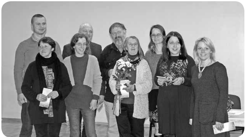
Sāvienas ekspedīcijas dalībnieki.

Nirēji stāstīja par paša plota izveidi - kā noticis šis process no idejas līdz rezultātam. Latvijā līdz šim nebija pieejams plots ar grunts sūkni artefaktu izpētei, pacelšanai. Tāds bija tikai redzēts Discovery kanālos un ārzemju interneta portālos, tādēļ bija jāiegulda liels darbs, lai to izveidotu pašu spēkiem. 2015./2016. gadā notika teorētiskās bāzes izstrāde. Amerikas zelta celtniecības mājaslapā iespējams redzēt attēlus, bet agregātam nav doti konkrēti izmēri un aprēķini. Tika nolemts, ka nepieciešams ežektorijas sūknis ar jaudu 1600 l/min. Paralēli sūknim tika veidots arī plots - pontona tipa plots ar saliekamu rāmi. Plots un sūknis, un visas nepieciešamās konstrukcijas svēra apmēram 700 kg. Tādēļ bija nepieciešams piedomāt arī pie pārvietošanas, iekraušanas un izkraušanas.