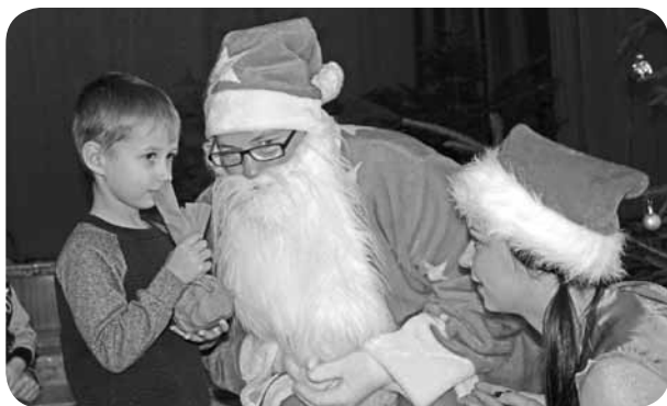
Mirkļi no bērnu satikšanās ar Ziemassvētku vecīti.

Bailīgāk vai drošāk - tomēr ikviens vēlējās palūkoties Ziemassvētku vecītim acīs un pasēdēt mīļajā klēpī. Visi bērni par dzejolišu skaitīšanu saņēma gardumus no Ziemassvētku vecīša. Savukārt tie bērni, kas vēl neapmeklē bērnudārzu, dāvanā no vecīša saņēma košu grāmatu, piparkūku ar savu vārdu un Madonas gardo karameli.