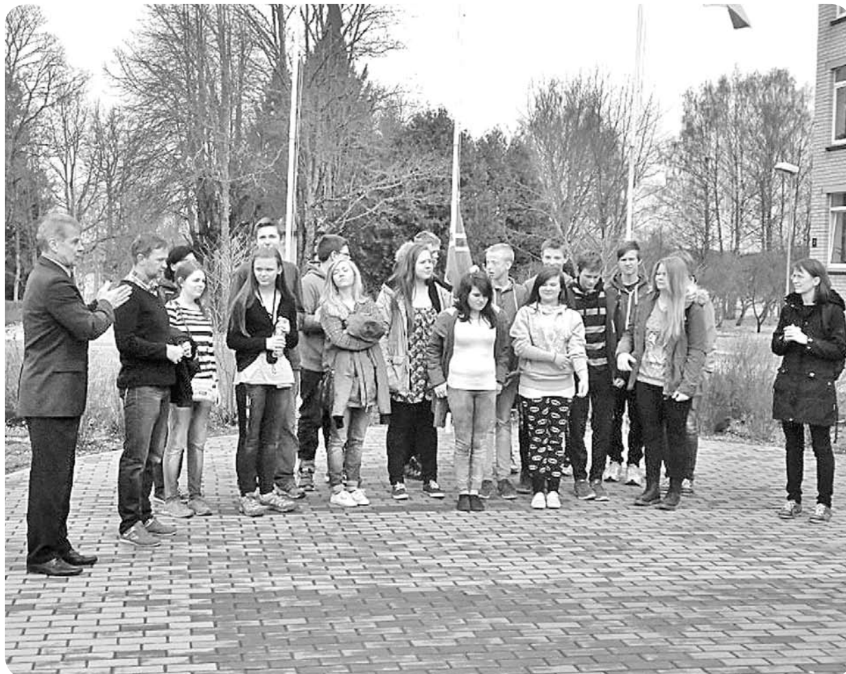
Sagaidot norvēģus, skolas pagalmā svinīgi tika uzvilkti Norvēģijas valsts karogs.

Laikā no 5. līdz 10. aprīlim Ļaudonā viesojās skolēnu un skolotāju delegācija no Norvēģijas - Mouldes kristīgās skolas. A. Eglīša Ļaudonas vidusskola laipni uzņēma jauniešus, izmītinot viņus internāta telpās un piedāvājot iespēju tikt ar skolēniem. Viesu delegācijas grupa no Ļaudonas aizbrauca ar prieku piepildītu sirdi, viņus patiesi aizkustināja ļaudoniešu atvērība un viesmīlība. Plašāk lasiet par norvēģu viesiem avīzes 4. lpp.