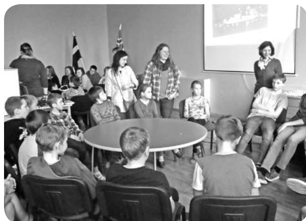
Sarunas - kopīga mācību stunda - ar 4.klases skolēniem.

Nemanot bija pienācis noslēguma pasākums, kurā jaunieši no Norvēģijas pateicās par ļaudoniešu viesmīlību, draudzību, sarunām, garšīgo ēdienu, ērto dzīvošanu un viesmīlīgajām ģimenēm, kuras labprāt jauniešus uzņēma pie sevis ciemos. Viesi atzina, ka šīs dienas viņu dzīvē ir bijis patiešām kaut kas īpašs. Pasākumā sveiciena dziesmu veltīja arī skolas kristīgā