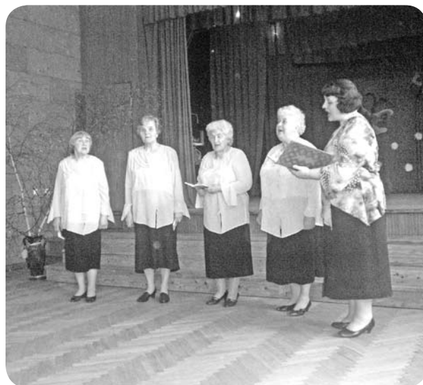
Sieviešu klubiņa vokālais ansamblis „Mežrozītes”.

- Audz apaļš kā pūpols, vesels kā rutks!