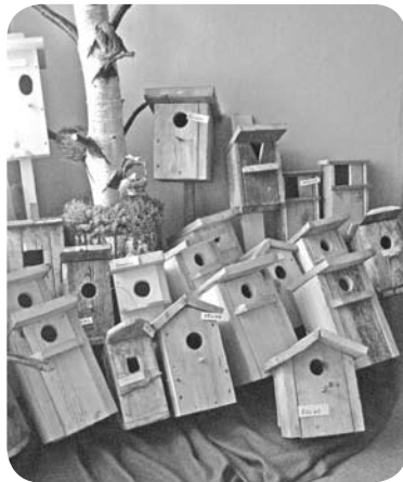
Bērni kopā ar vecākiem sarūpēja vairākus desmitus mājiņu putniem.

„Strazdi - tie atlidos jau drīz...” Šāds vēstījums nonāca arī „Brīnumdārzā”, kuru sadzirdēja un uz to atsaucās daudzi bērni kopā ar saviem vecākiem. Vēstījums bija ar domu pagatavot putniem būrīti. Aizsākās sarunas par putniem, nometniekiem, tiem, kuri atlido no siltajām zemēm un kuriem nu te ir vajadzīgas savas „mājiņas”.