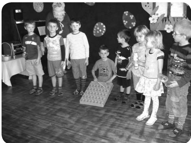
"Rūķu" grupa sniedz muzikālu priekšnesumu.

Pirmdienas tēma - „Noklausies skaņdarbu un uzzīmē to!”. Katra grupa klausījās savu skaņdarbu (A. Žilinska „Lācītis,” P. Rimska - Korsakova „Kamenes lidojums,” E. Grīga „Kalnu karaļa alā”) un savos zīmējumos atainoja to, ko klausoties bija iztēlojušies. Iestādes foajē tika veidota interesanta jauno mākslinieku izstāde.