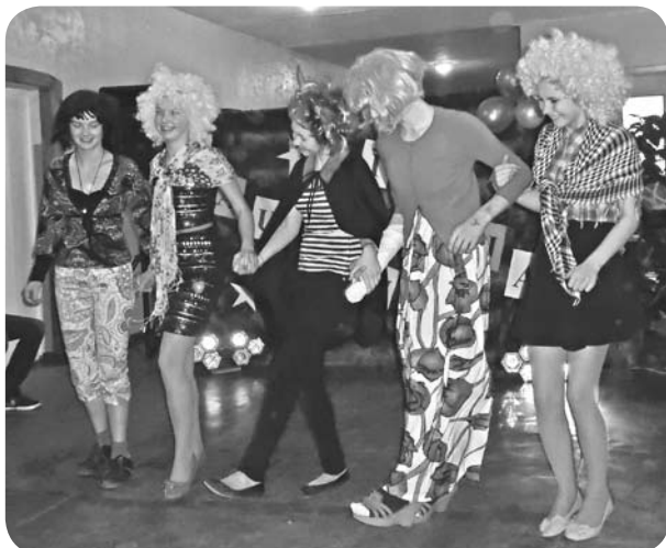
8. un 10. klase demonstrējot sagatavotos atraktīvos priekšnesumus.

14. martā skolā notika pasākums "Ļaudonvīzija jeb citāda Eirovīzija". Katrai klasei bija jāizvēlas dziesma un fonogrammas pavadījumā tā jānodzied.