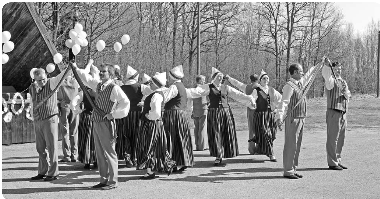
Ļaudonas pagasta senioru paaudzes deju kolektīvs „Divi krasti”.