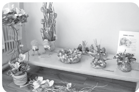
Bibliotēkas telpās tiek izkārtotas dažādas izstādes, aprīlī apmeklētājus priecēja floristikas darbu izstāde.

„Zvirbulis bez astītes” 24. marts - 4. aprīlis.