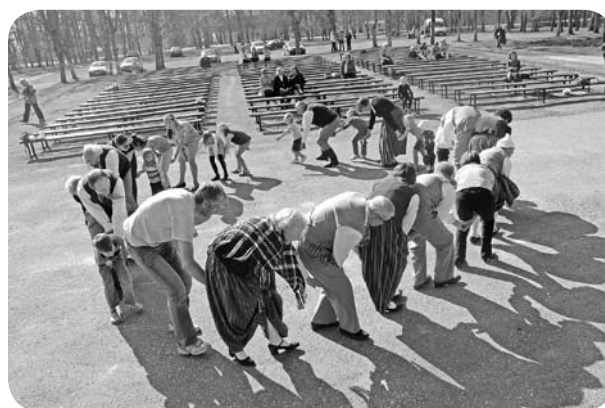
Jautrās rotājās kopā ar folkloras kopas dalībniekiem iesaiņījās gan lieli, gan mazi.

Kad andelēšanās pierima, Lieldienu koncertu ieskandināja deju kolektīvs „Divi krasti”, pēc dančiem klātesošos iepriecināja folkloras kopa „Madava” no Barkavas. Dziedot tautasdziesmas un atgādinot Lieldienu tradīcijas, ticējumus un paražas, tika izpušķotas šūpoles. Pēc šūpošanās ikviens tika aicināts piedalīties latviskās rotājās. Tās aizrāva gan lielus, gan mazus, ļaujot izbaudīt Lieldienu īstenu latviskā garā.