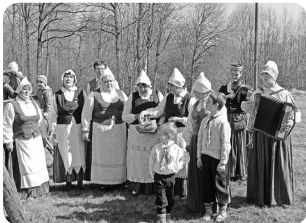
Folkloras kopa „Madava” ieskandināja Lieldienas ar tautasdziesmām un latviešu paražām.