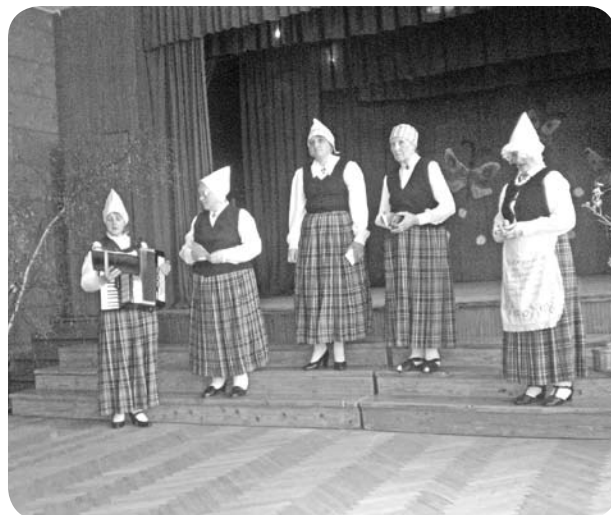
Meirānu TN tradīciju kopa “Sietiņš”.