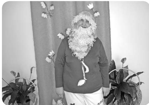
Ar bērniem Mūzikas nedēļas noslēgumā kopā bija Dziesmu Rūķis (mūzikas sk. Judīte Gūte).

Ceturtdienas tēma - „Klausāmie un atdarinām putnu balsis!”. Putnu balsis bērni klausījās gan ierakstos, gan dabā. Šajā dienā galvenais uzdevums bija iemācīties piecu putnu balsu atdarināšanu.