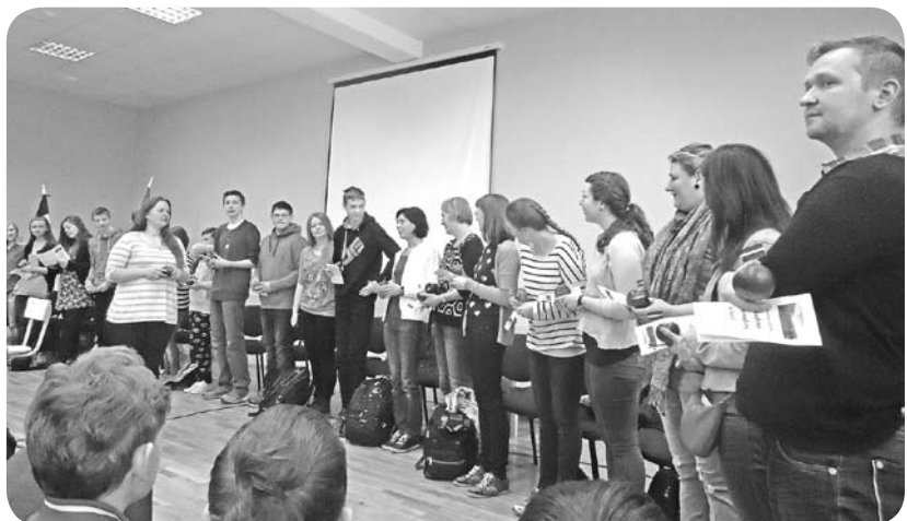
Norvēģu jaunieši iepazīstina ar sevi.

Turpmākajās dienās norvēģu jaunieši tikās ar katru klasi (4.-12.) atsevišķi, lai pastāstītu un parādītu sagatavotās prezentācijas par savu valsti, skolu, un piedalījās diskusijās un sarunās ar mūsu