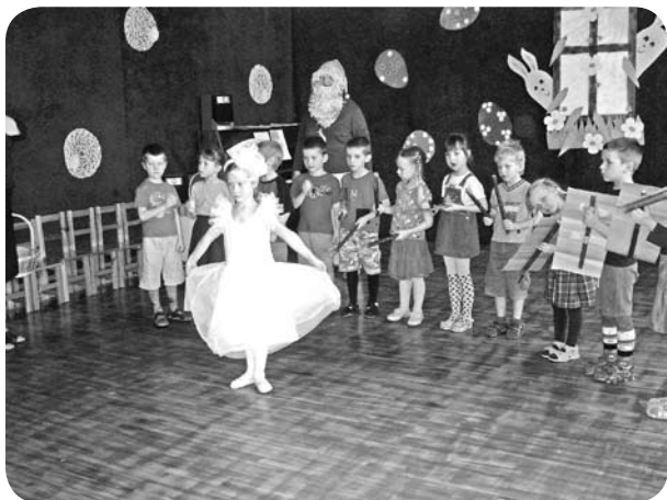
"Kaķu" grupas bērni priekšnesuma laikā.

Aprīli mēdz dēvēt ne tikai par Sulu, bet arī par Mākslas dienu mēnesi. Vārds māksla tiek lietots saistībā ar dažādiem radošās izpausmes veidiem un viens no tiem - mūzika.