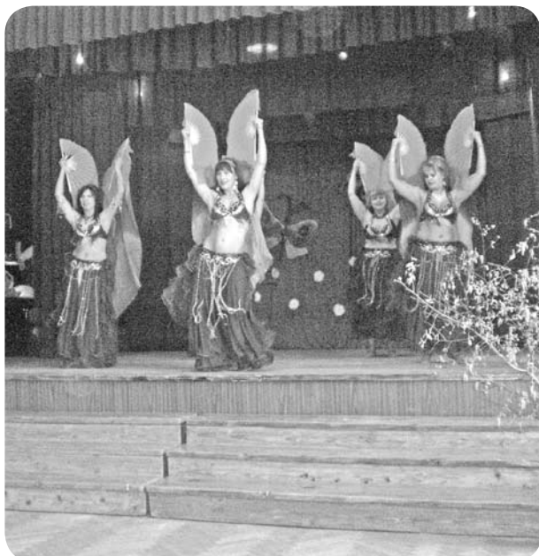
Ar krāšņām dejām priecēja vēderdeju grupa „Oreo” no Bērzaunes.