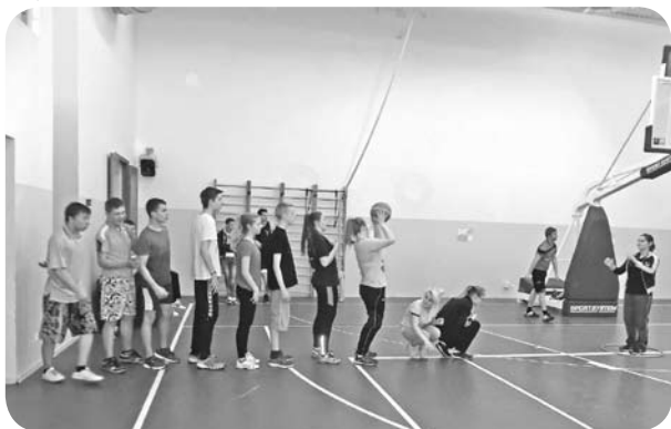
Sporta aktivitātes starp skolēniem un Norvēģijas jauniešiem.

Interesanta un atraktīva izvērtās kopīgā sporta pēcpusdiena skolā, kurā sacentās mūsu skolas un viesu jautkās komandas. Protams, uzvarēja draudzība!