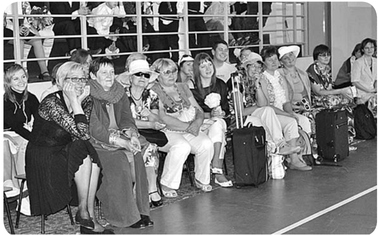
Ceļotāji ar interesi vēro savus kolēģus pārbaudījumu laikā.