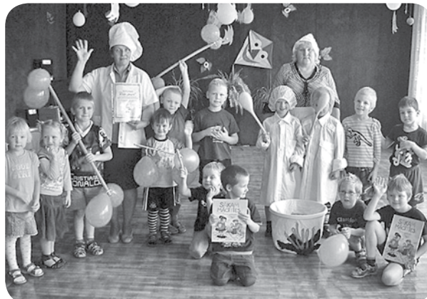
„Rūķu” grupas bērni kopā ar skolotājām bija sagatavojuši priekšnesumu, kas veltīts Vispasaules putras dienai.

Projekta laikā audzēkņi ne tikai baudīja dažādas putras, bet arī noskaidroja, no kā un kā tās tiek gatavotas, pētīja