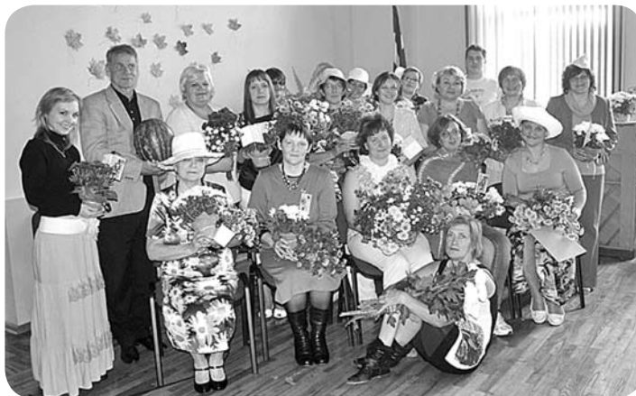
Laimīgi piezemējušies un smaidīgi, skolotāju kolektīvs savā svētku dienā.

ieguldīto darbu un izdomu šīs svētku dienas tapšanā, sarūpējot skolotājiem interesantu, piedzīvojumiem un pozitīvām emocijām piepildītu ceļojumu. Arī paši skolotāji atzina, ka bija interesanti un aizraujoši. Šāda veida Skolotāju diena saliedēja kolektīvu un skolēniem sniedza iespēju uz skolotājiem paskatīties neierastākā, neformālā gaisotnē.