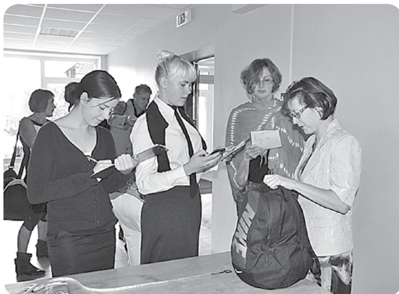
Viens no pirmajiem pārbaudījumiem – personas apliecināšo dokumentu pārbaude.

Ik gadu oktobra pirmajā svētdienā tiek atzīmēta Skolotāju diena. Sveicot savus skolotājus, arī skolēni allaž parūpējas par svētku noskaņu, lai skolotāji var uz mirkli nolikt malā ikdienas rūpes un ļauties skolēnu sagatavotajiem apsveikumiem. Šajā gadā Skolotāju diena A.Eglīša Ļaudonas vidusskolā noritēja