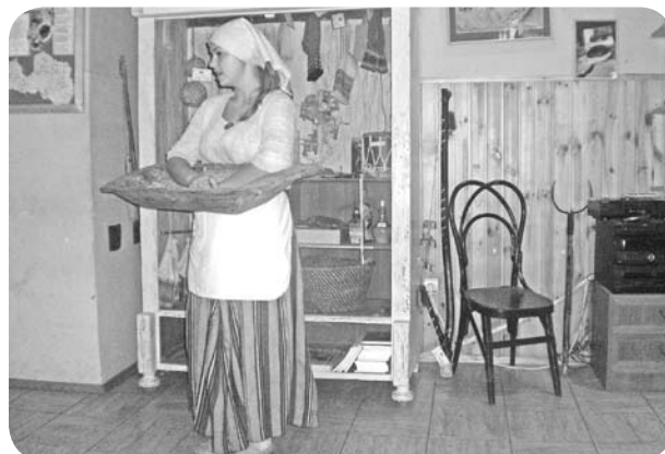
Aglonas maizes muzeja saimniece stāstījums.

Muzeja apmeklētājus saimniece uzņem latgališu tautas tērpā, uzrunājot latgališu valodā. Iepazīstināšana ar godā celto Latvijas rudzu maizes klaipiņu noris teatralizēta uzveduma veidā, kurā saimniece pastāsta par labības audzēšanu, rudzu grauda atpazīšanu, tā izgaršošanu, kā arī maizes tapšanas kārtību, tās cepšanu un ēšanu, kā arī tradīcijām Latgalē. Muzeja apmeklētājiem ir iespējams pagaršot rudzu maizi,