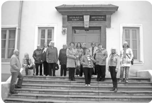
Ekskursantu grupiņa pie Krustpils pils.

11. oktobra rītā mūsu klubīna „Mežrozīte” dalībnieces priecīgā noskaņojumā varēja sākt jau augustā ielānāto ekskursiju pa skaisto Latgalīti. Ekskursijas maršruts Krustpils pils - Līvānu stikla fabrikas muzejs - Aglonas maizes ceptuve - Kristus Karaļa kalns.