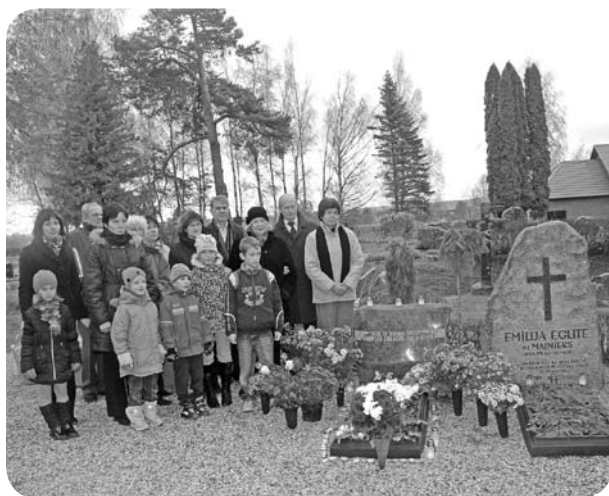
Ļaudonieši un viesi dzejnieka piemiņas vietā.

"Mīlestība un putekļi – ienāk bez atslēgām dvēselē un telpā."