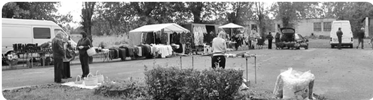
Uz Ļaudonas tirdziņu bija sabraukuši apmēram 12 tirgotāji, kas piedāvāja gaļas kūpinājumus, ziedu stādus, apģērbus un apavus, saimniecībā noderīgas lietas.