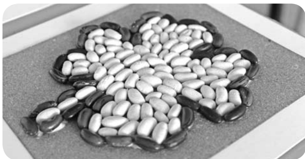
No pupiņām tika darināts mazpulku simbols – četrlapu āboliņš.