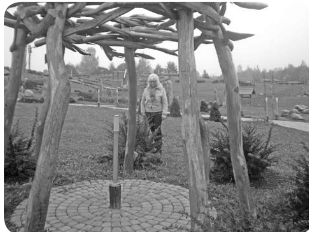
Kristus Karaļa skaistajā kalnā.

Pēdējais apskates objekts - Kristus Karaļa kalns. Iespēja aplūkot koka skulptūru kompleksu, kurā izvietotas 54 skulptūras