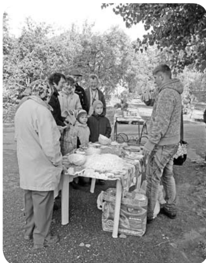
Īpašu interesi ļaudoniešos izraisīja kāds virtuves instruments, ar kuru veic dažādas funkcijas. Par šo instrumentu ar azartu stāstīja atraktīvais pārdevējs.