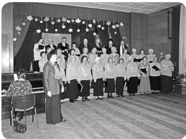
Cēsu senioru jauktais koris „Ābele”.