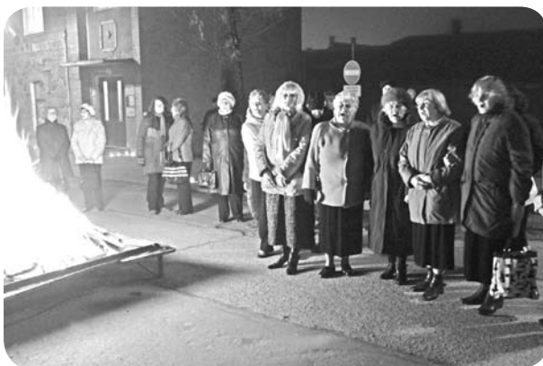
“Mežrozītes” ansamblis pie ugunsкура Poruka ielā.