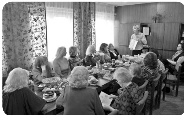
Forever Living Products prezentācija.

mērot. Pēc tam pasākums turpinājās Poruka ielā, kas mūs līdž asarām savīļoja, ieraugot tur neskaitāmās svečtšu liesmiņas un lielo ugunsкура pašā ielas vidū. Tā bija fantastiska sajūta šajā svētku dienā, kas katram no mums lika padomāt, cik mūsu zeme ir svēta. Tur arī skanēja dziesmas, dzeja un brīvības cīņu stāsti. Pasākums bija kupli apmeklēts. Ļoti daudz bija jauniešu, kuriem interesē pagātnes notikumi, kuri mīl savu zemi, savu valsti un tautu.