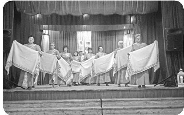
Svētku koncertā uzstājās Kalsnavas dāmu deju grupa „Magnolijas”.