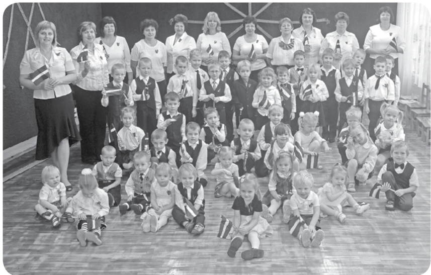
„Brīnumdārzs” svētku noskaņā.