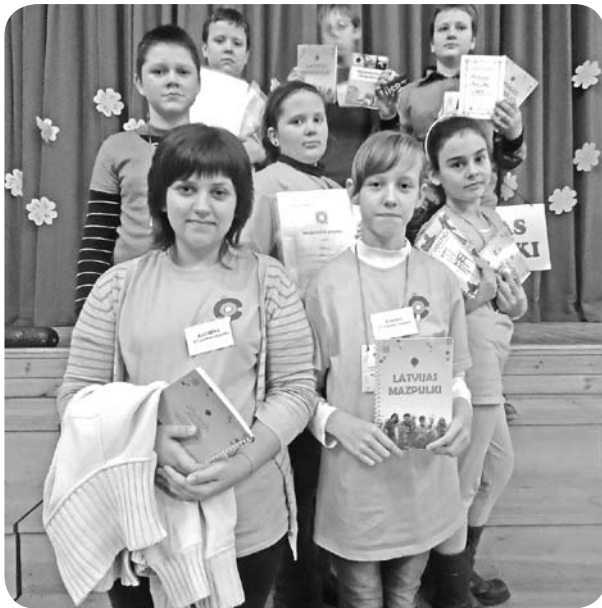
Ļaudonas mazpulcēni Projektu forumā.

Septembra, oktobra mēneši 117. Ļaudonas mazpulkā pagāja, gatavojoties Vidzemes novada Mazpulku projektu forumam. Mazpulcēnu vasaras darbs bija rūpīgi jāatspoguļo individuālajos vasaras darbu projektos. Pēc veiktā darba un sagatavotās izstādes 26. oktobrī 8 skolēni piedalījās projektu forumā Palsmanē.