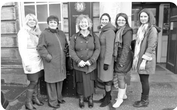
Latvijas delegācija pie Edinburgas universitātes.