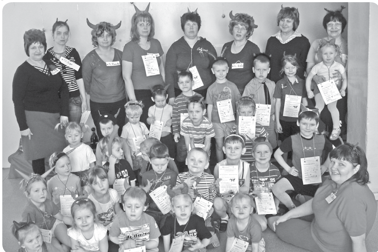
PII „Brīnumdārzs” no 18. līdz 21. februārim mājāja mazi un lieli, palaidīgi un paklausīgi velniņi.