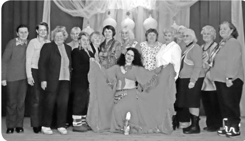
„Mežrozītes” dalībnieces 8.marta svētkos kopā ar eksotisko deju studijas dejojāju.

Nodarbības veidotas, lai dotu cilvēkiem iespēju satikties un domubiedru grupā reizi nedēļā gan veselīgi izkustēties, gan rast atbildes uz interesējošiem jautājumiem, gan arī emocionāli uzlādēties un vienlaicīgi atpūsties. Cilvēku atveseļo un dod tam nepieciešamo enerģiju nodarbes, kas no sirds patīk un sagādā