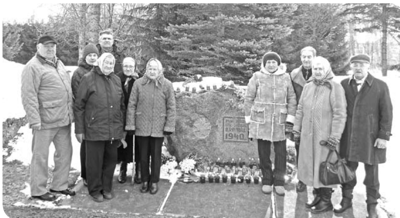
Piemiņas pasākumā pulcējās daļa no ļaudoniešiem, kuri piedzīvojuši 1949. gada deportāciju.

25. martā pieminam cilvēkus ar stipriem likteņiem un dzimtenes izjūtu, kuriem šis datums sirdīs ievieš sāpīgu nemieru. Arī šogad ļaudonieši, kuru likteņus skārusi 1949. gada izsūtīšana, pulcējās pie Piemiņas akmens Ļaudonā, lai ar klusuma brīdi un līdzilvēkiem blakus pieminētu latviešu tautas sūro likteni. Pēc piemiņas brīža pasākums turpinājās Ļaudonas „Brīnumdārza”, kur sirmgalvjus iepriecināja bērnu dārza audzēkņu sagatavotie