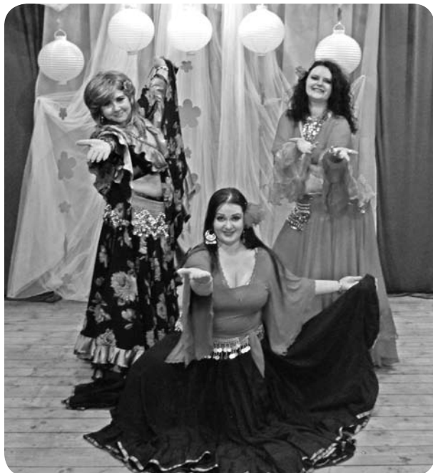
8. marta koncertā ļaudoniešus priecēja vēderdeju, indiešu deju un temperamentīgu čigānu deju izpildītājas no studijas „Mantigra”.