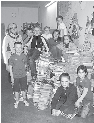
3. klases skolēni kopā ar audzinātāju.