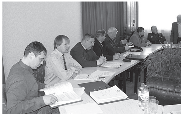
Komisijas sēdes laikā.

Sēdes laikā tika uzklauts ezera piekrastes zemju īpašnieku atšķirīgais viedoklis – vieni īpašnieki atbalsta zveju ezerā, savukārt citi pret to iebilst. Tomēr šajā jautājumā zemju īpašniekiem ir jāvienojas pašiem. Zvejniecības un medību tiesību komisijai nav tādu tiesību pieņemt lēmumu pretēji ezera piekrastes zemju īpašnieku gribai.