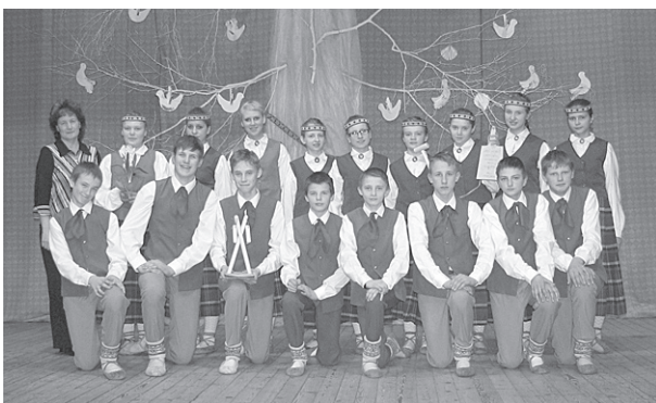
Vidusskolas deju kolektīvs ar iegūto "Sprigūļa" balvu.