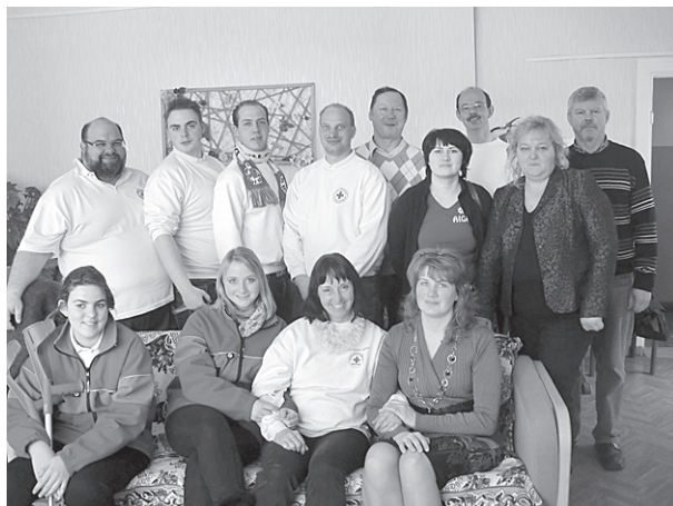
Vācu draugi kopā ar ļaudoniešiem un madoniešiem.

Bija patīkami klausīties, kā tulks tulkoja: „Ja viņiem būtu mazi bērni, tad viņi gri-bētu, lai viņi nāktu mūsu „Brīnumdārzā””.