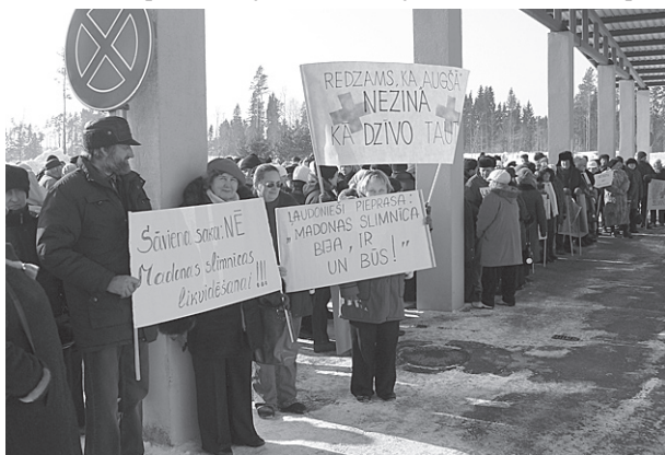
Sāvēnieši un ļaudonieši piketa laikā.