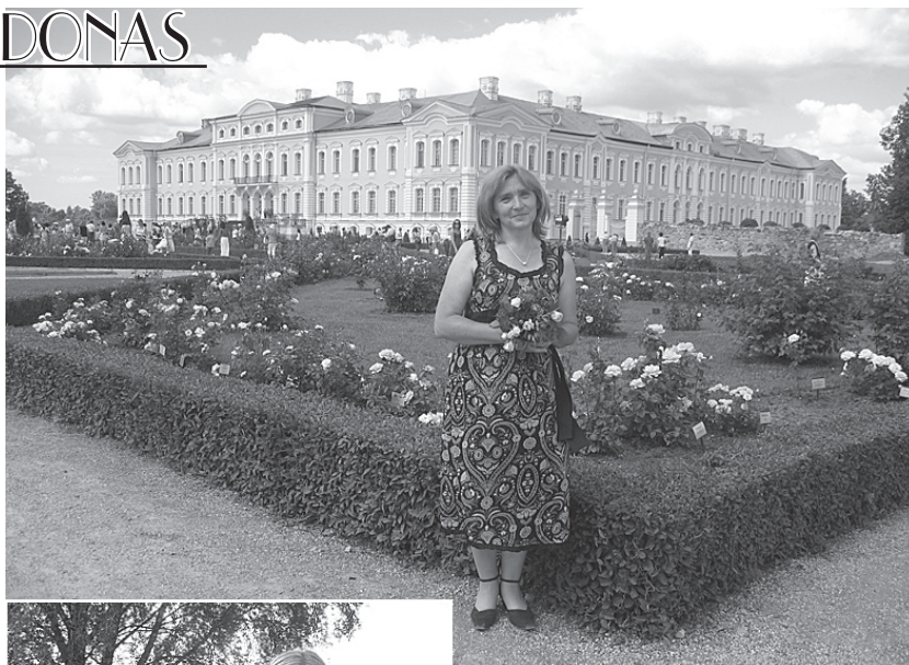
Rundāles pils rožu svētkos 2010. gada vasarā.