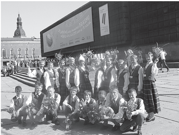
5.-9. klašu deju kolektīvs.