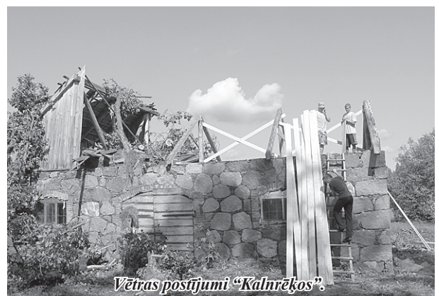
Vētras postījumi "Kalnrēķos".