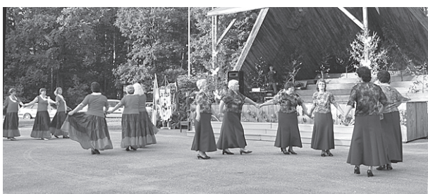
Dejo Ļaudonas un Kalsnavas dāmu deju grupas.