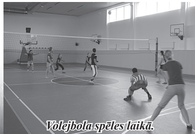
Volejbola spēles laikā.