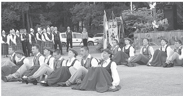
Mētrienas jauniešu deju kolektīvs.