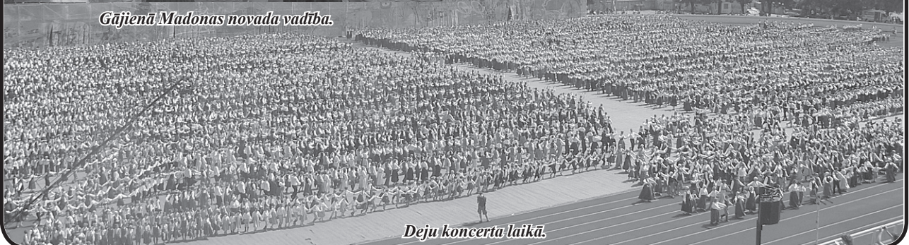
Deju koncerta laikā.