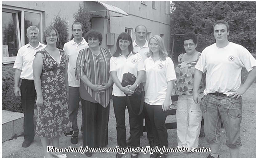
Vācu ciemiņi un novada pārstāvji pie jauniešu centra.

19. jūlijā Madonas novadu apmeklēja pieci Vācijas Sarkanā Krusta Rosrātes nodaļas pārstāvji. Rosrātiešu mērķis šoreiz ir bijis palūkoties, kā klājas viņu draugiem – palīdzības saņēmējiem, kādas ir viņu vajadzības, vai iepriekšējās reizēs atvestās lietas ir guvušas labu pielietojumu. Šajā ciemošanās reizē rosrātieši uzdāvināja pirmās palīdzības auto Madonas novada Sociālajam dienestam. Rosrātieši ciemojās arī mūsu pagasta Sociālajā aprūpes centrā un Jauniešu centrā. Rosrātieši priecājās par pozitīvām pārmaiņām Sociālās aprūpes centrā, par šūpolēm pirmsskolas izglītības iestādē, kuras viņi dāvāja pirms vairākiem gadiem. Ciemiņi apmeklēja pagasta jauniešu centru. Centra apmeklējums viņiem atstāja pozitīvu iespaidu, jo pēc viņu teiktā,