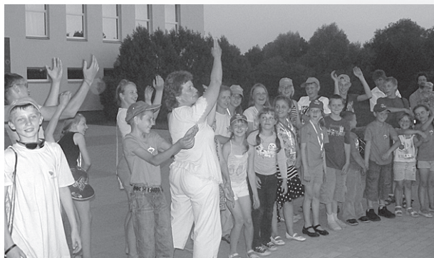
Prieks par paveikto.