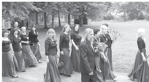
Koris "Lai top!".