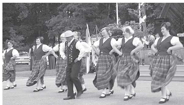
Pagasta vidējās paaudzes deju kolektīvs.