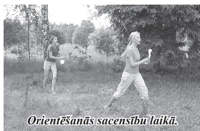
Orientēšanās sacensību laikā.