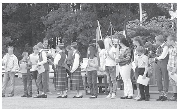
Veiksmīgāko sportistu apbalvošana.