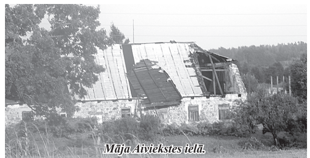
Māja Aiviekstes ielā.