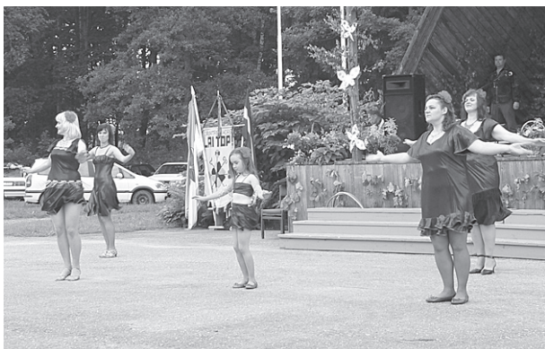
Eksotisko deju grupa.