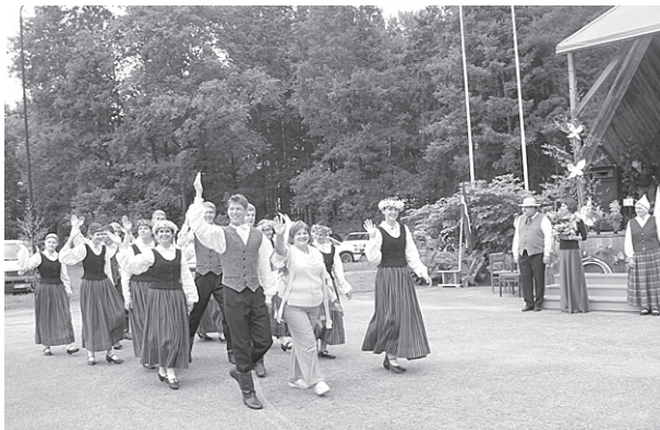
Viesi – Kalsnavas jauniešu deju kolektīvs.