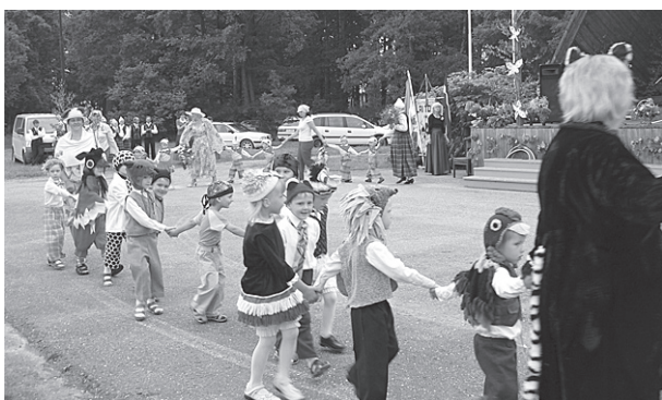
Uzstājas PII “Brīnumdārzs” audzēkņi.