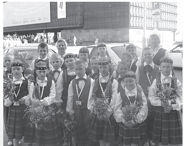
1.-4. klašu deju kolektīvs.