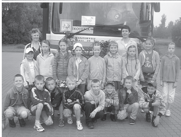
Mirklis pirms došanās uz Rīgu.