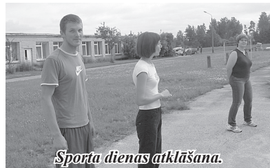
Sporta dienas atklāšana.