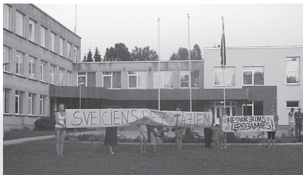
Ar plakātiem un mūziku vecāki sagaida savus bērnus.