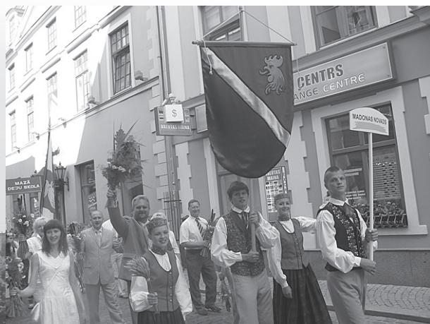
Gājienā Madonas novada vadība.