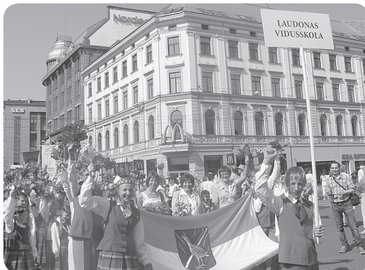
Vidusskolas dejotāji svētku gājienā Rīgā.

Augusts ir arī pirmo gājputnu aizceļošanas laiks, asteru un gladiolu laiks, kas liecina, ka pavisam drīz jau sāksies jaunais mācību gads.