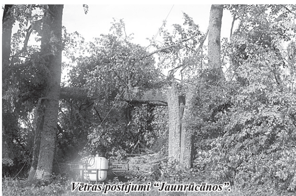
Vētras postījumi "Jaunrūcānos".