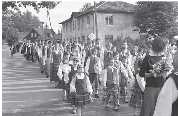
Gājienā vidusskolas dejojāji.