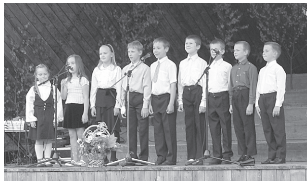
Vidusskolas skolēnu ansamblis.