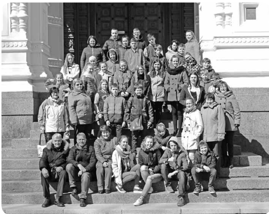
Skolēni un skolotāji – priecīgi par interesanto un iespaidiem pilno braucienu uz Igauniju.