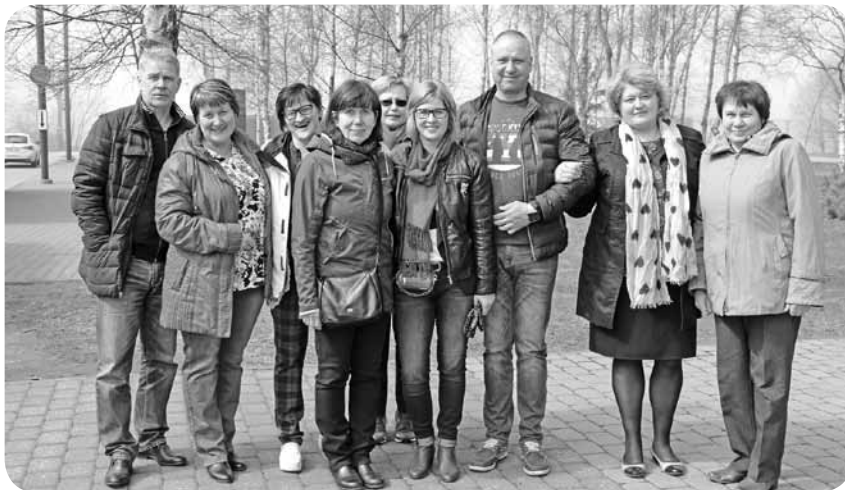
A.Egliša Ļaudonas vidusskolas skolotāju delegācija kopā ar Igaunijas kolēģiem.

Nākamais rīts atkal bija mokoši agrs, jau plkst. 7:30 bija jābūt nomodā, jāizlaiž no matračiem gaiss, jāsakārto telpa un jānododas uz rīta vingrošanu. Jāpiemin, ka visi gaidīja kārtīgu izstaiptāšanos, taču bijām pārsteigti, ka mazais sportiņš bija vien trīs minūtes garš. Kopīgi pabrokastojām un devāmies ceļā uz Igaunijas galvaspil-