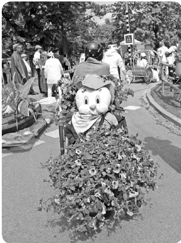
Ļaudonas komanda sev līdzī bija atvedusi Madonas gailim draugu – cāli.

Bet ar parādi viss tikai sākās! Vēl jāpiedalās sacensībās! Plašam atbalstītāju un skatītāju lokam klātesot, uz