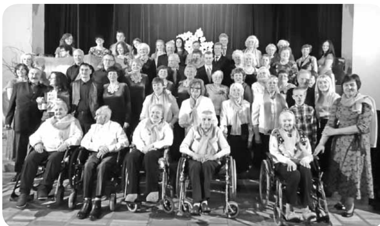
Koncerta dalībnieku kopbilde.

Laiks aizritēja nemanot, jo pasākuma otrajā daļā bija iespējams gan padziedāt, gan padejot un piedalīties jautrās atrakcijās.