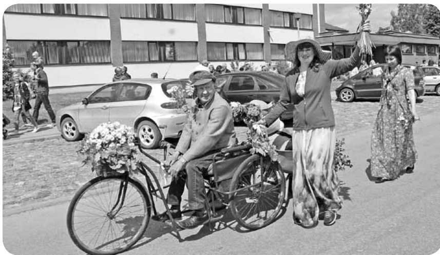
Visi sacensību dalībnieki devās parādes gājienā pa Madonas ielām.

Skolas ielas norisinājās braucamrīku sacensības. Un, lai arī nebraucām uz šīm sacensībām ar domu, ka Ļaudonas braucamrīks spēs konkurēt ar citiem ratiem ātrumā, tomēr ieguvām godpilno II vietu! Par to paldies komandai!