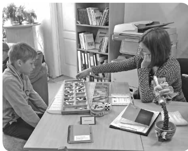
Starptautiskajai bērnu aizsardzības dienai veltītajās aktivitātēs ar prieku piedalījās gan lielāki, gan mazāki bērni.

lai bērniem būtu prieks un viņi justos kā īstā svētku reizē.