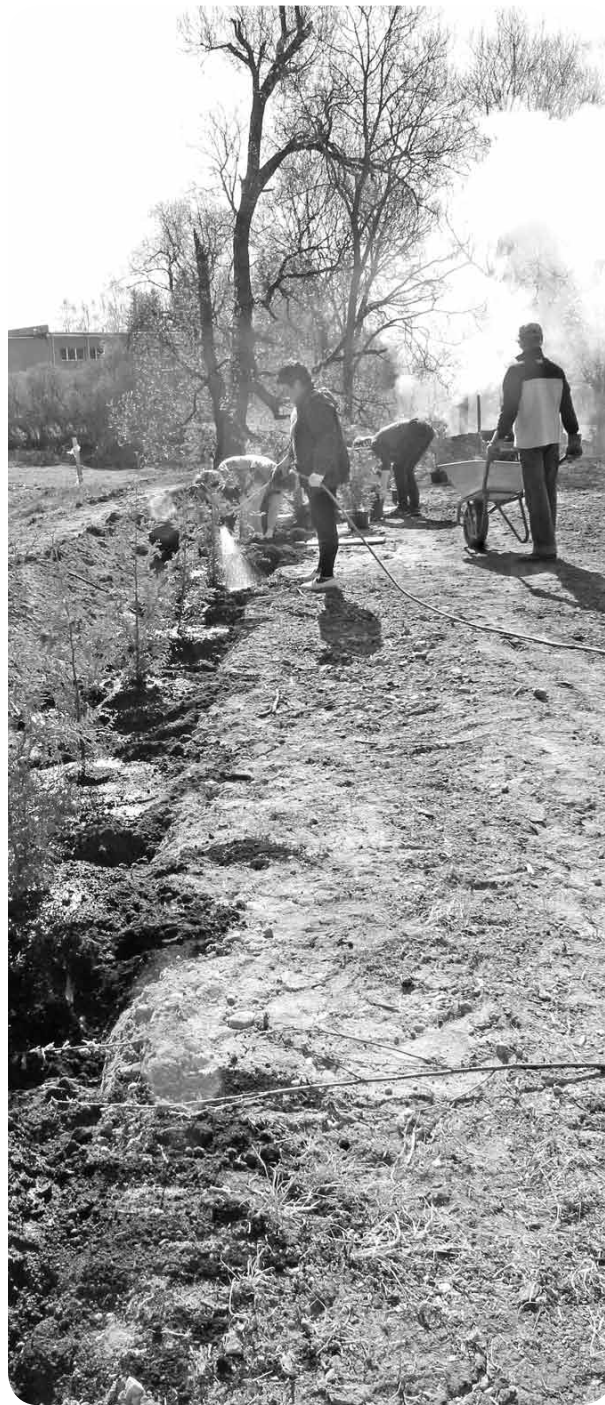
Stādot tūjas, darba pietika visiem talciniekiem. Nu katlu mājas teritorija tapusi sakoptāka.

13. maijā ļaudonieši bija aicināti piedalīties pavasara talkā. Pagasta sakopšanas talkā darba rokas tika pieliktas pie Avotu ielas katlu mājas teritorijas - sakopta apkārtnē un iestādītas vairākas tūjas. Tūjas veidos apjomīgu un skaistu dzīvzogu, lai paslēptu malkas grēdas un skaidu kaudzes.