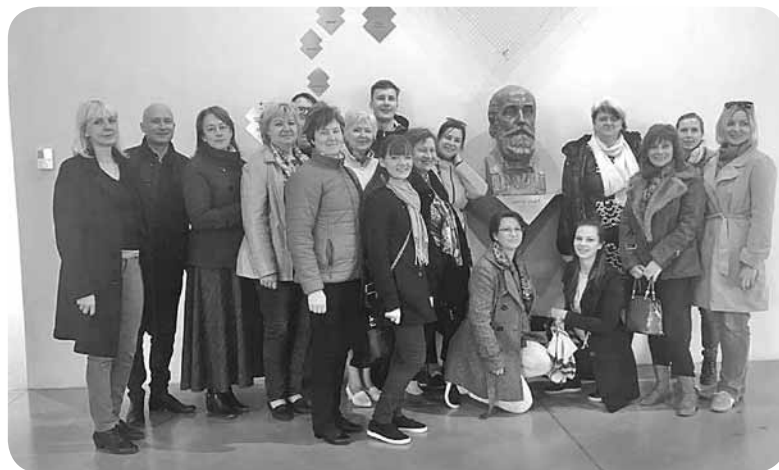
Novada kultūras darbinieki Igaunijas Nacionālajā muzejā.

Brauciena nākamajā dienā apmeklējām Igaunijas Nacionālo muzeju. Šis muzejs tika atklāts 2016. gada 1. oktobrī un noteikti neatstāj nevienu vienaldzīgu sava plašuma (gan telpiski, gan tehnoloģiski, gan emocionāli) ziņā. Nacionālais muzejs ir igauņiskuma saglabātājs, tautas pamatvērtību nesējs un nepārtrauktības uzturētājs. Mums tika atvērta gan materiālā, gan virtuālā pasaule, kas aicināja atklāt, izziņāt un pašam visā piedalīties. Muzejs ir ļoti mūsdienīgs, piedāvājot apmeklētājiem ekspozīciju baudīt ar vairākām maņām, ne tikai redzi. Muzejā ir divas pastāvīgās ekspozīcijas. "Tikšanās" ir izstāde par vienkāršiem Igaunijas cilvēkiem, kas šajā zemē dzīvojuši visos laikos, attēlojot tradicionālo kultūru un tautas iezīmes cauri gadiem. Izstāde "Urāla atskaņas" parāda somugru tautas un