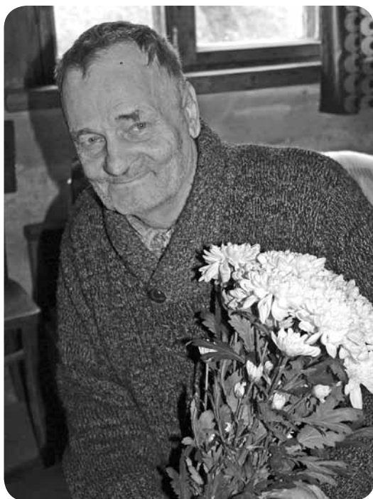
Signes Prušakevičas teksts un foto

Vēlam jubilāriem veselību un saulainu dzīvesprieku!