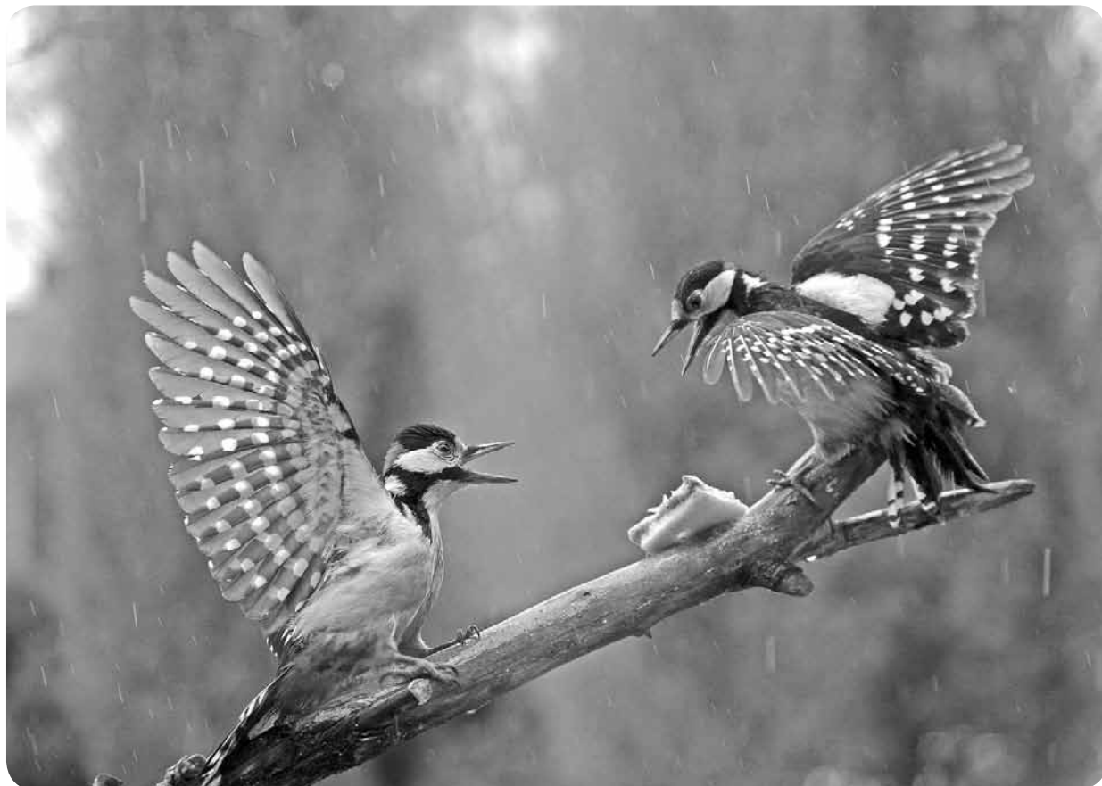
Vairāk par Valda skaisto vaļasprieku - fotogrāfšanu - varat lasīt 4. lpp.