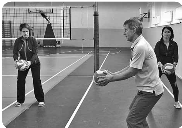
Semināra praktiskajās nodarbībās skolotāji apguva volejbola tehnikas paņēmienus.

Anitas Kidalas, sporta skolotājas, teksts un foto