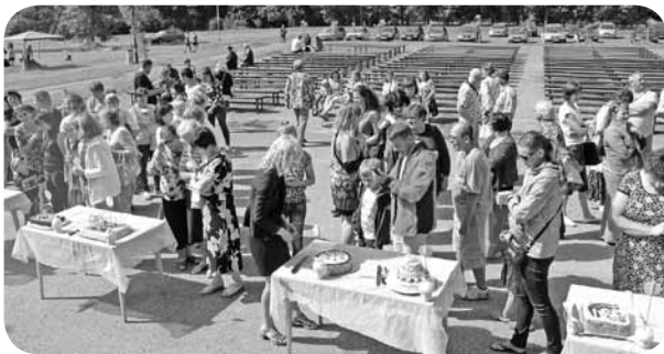
Kūku konkursa žūrija bija paši ļaudonieši, kas vērtēja gan kūku vizuālo noformējumu, gan garšu.