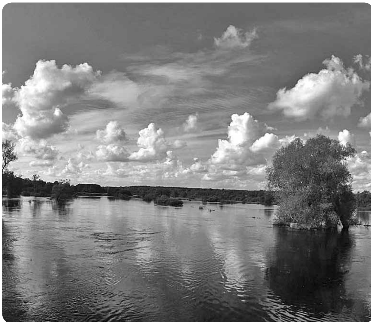
Vasaras izskaņā pēc ilgstošām lietavām dabas varenība radīja neatkārtojamu gleznu – Aiviekstes upes robežas un līmenis cēlās plašumā pa dienām, radot iespaidu, ka Aiviekste pārvēršas par ezeru.