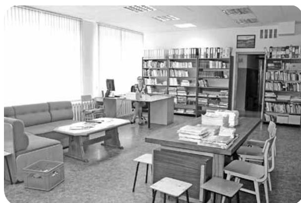
Saulainas un plašas telpas skolas bibliotēkai.

darbiņu, daudz kas jāpielabo un jāsakārto, bet tas viss notiks laika gaitā.