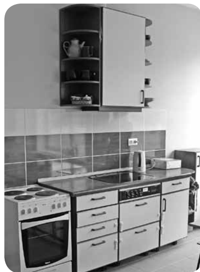
Izremontēts un labiekārtots mājturības kabinets.